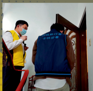
▲ 執行人員至義務人家中訪查

本分署與臺北市政府衛生局共同合作，依法積極辦理本案並與義務人家屬進行良好溝通，得以 24 小時內全額徵起 100 萬元快速執行完畢，期盼應進行居家檢疫或隔離者，皆能用心配合以免受罰，否則不但會引發接觸者之健康危險，本身所有之財產還可能會因為罰鍰未繳清而被強制執行。