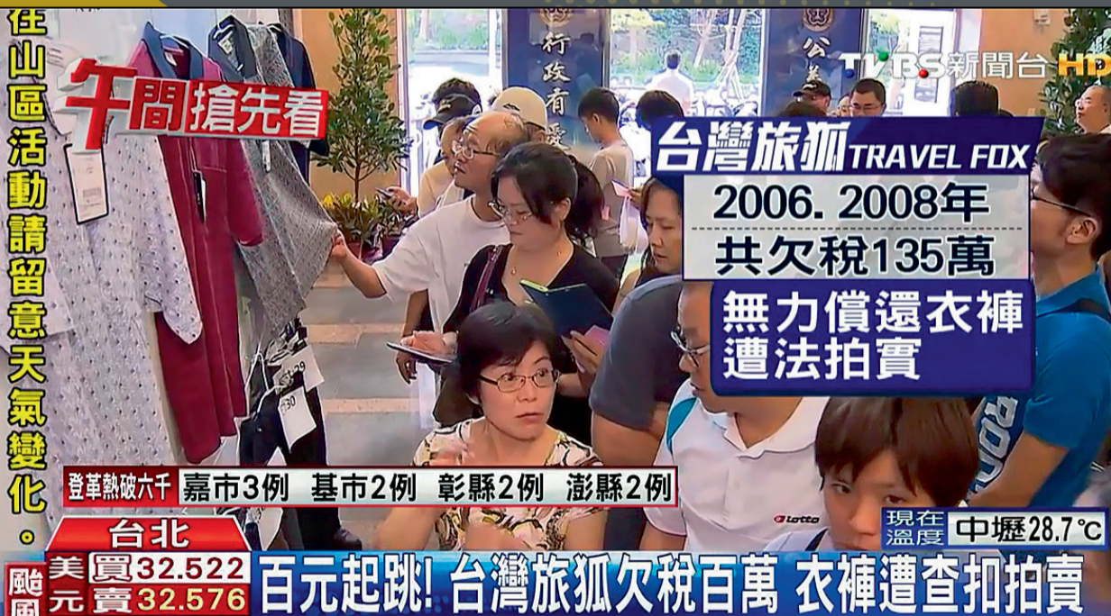
▲ 現場搶標新聞畫面

義務人台灣旅狐有限公司滯納營業稅合計 150 萬餘元，經詢問義務人之負責人，得知公司因景氣不佳以至於經營困難而倒閉，乃洽商負責人交出公司庫存尚未賣出之衣物供作拍賣繳稅，便查封義務人庫存之上衣 71 件、西裝褲 331 件，多次拍賣流標後進行動產變賣程序，以上衣每件 100 元、西裝褲每件 200 元之價格進行變賣，變賣標的物全數售出，不但清空義務人積壓之庫存，也繳納部分欠稅，達成雙贏局面。