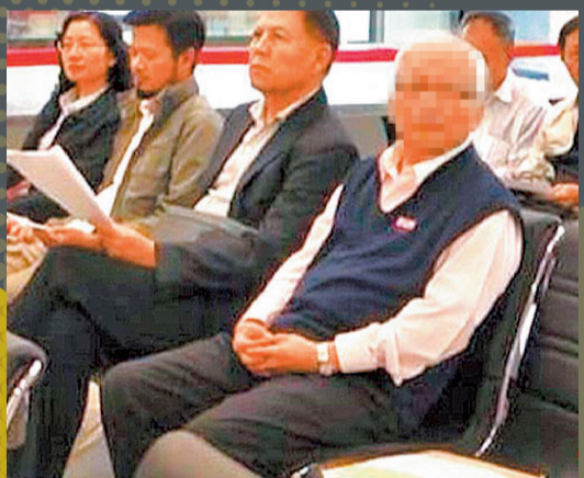
▲ 義務人至本分署關心拍賣情形