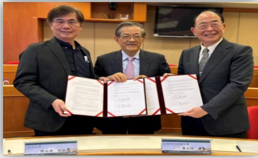
施榮譽講座、黃署長與鄧副校長合影

法制專業課程外，參與本課程的同學均將至臺中分署執行股實地參與執行實務運作，並觀摩分署重要活動（如每月123聯合拍賣等），期能落實學用合一。