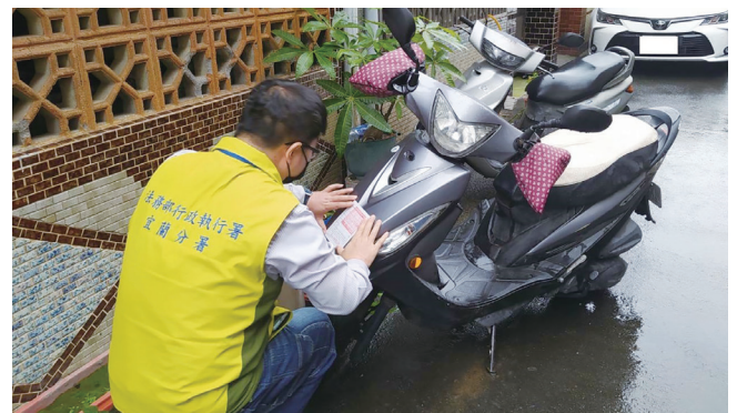
宜蘭分署查封酒駕義務人機車