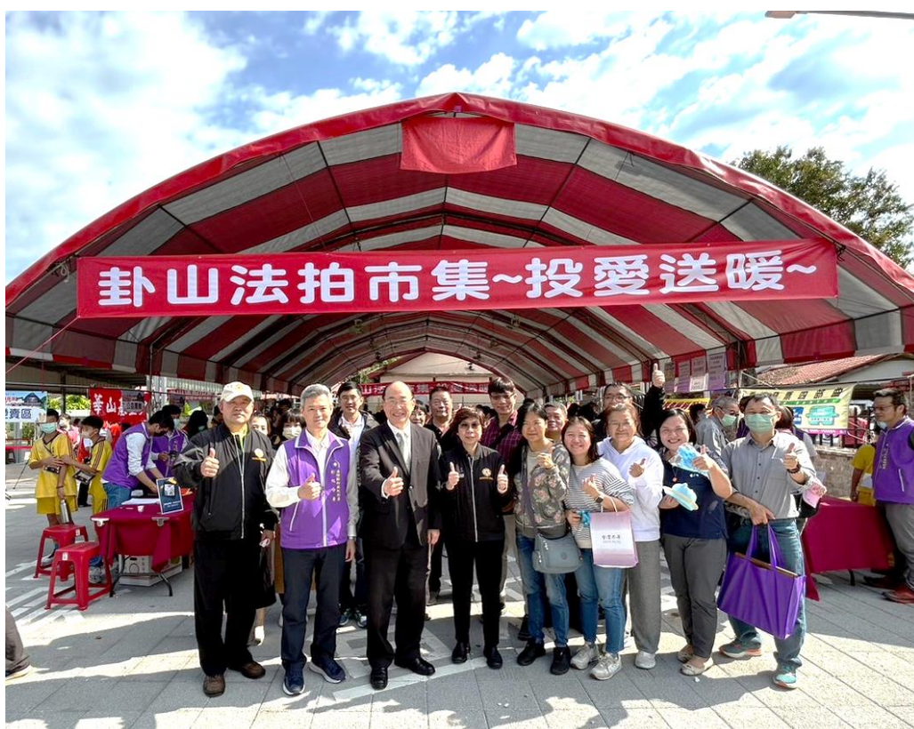
黃玉垣署長參與彰化分署「卦山法拍市集-投愛送暖」變賣會