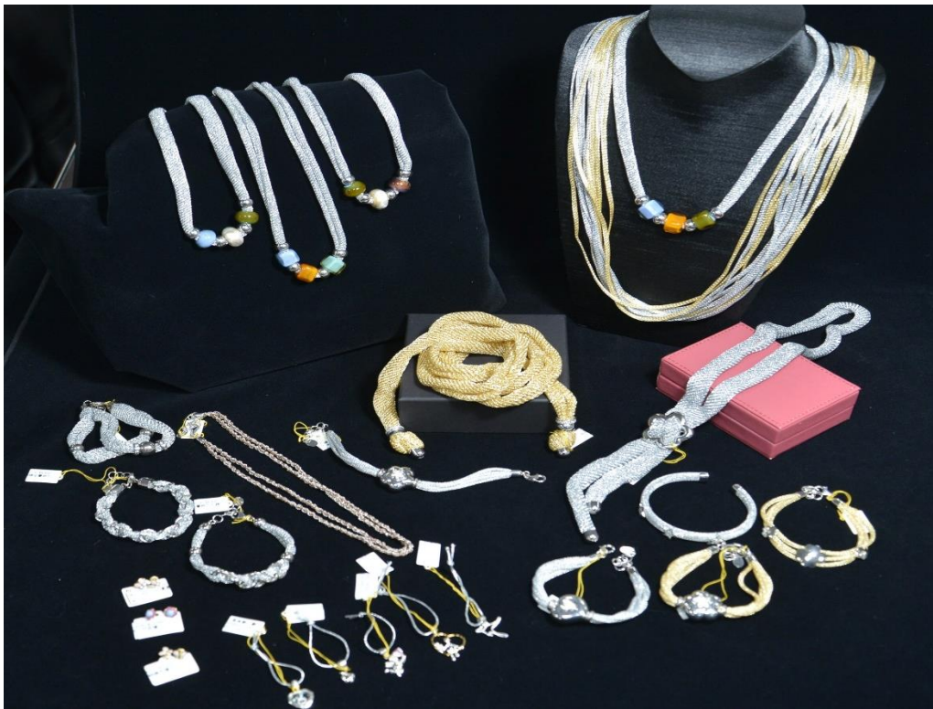
臺北分署推出「38婦女節千件珠寶首飾拍賣會」