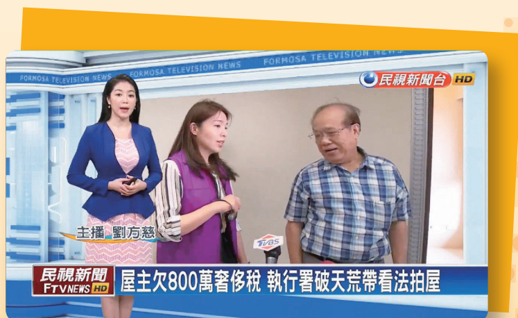
▲ 107 年 6 月 4 日民視新聞

此舉，吸引十幾家媒體到場採訪，將本分署拍賣豪宅的訊息，透過網路及電視新聞畫面，作宣傳報導，引起許多對法拍屋有興趣的民眾關注，最後，在經過幾次的減價拍賣後，「豪宅」以 2,400 萬元，順利賣出。