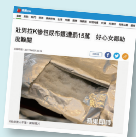
▲ 106年6月7日 蘋果即時新聞

此外，也有父母親寵小孩，將房屋過戶給兒子，兒子卻不學好，誤交損友，接觸三、四級毒品，因失業繳不起罰鍰，被移送強制執行，房子因此被查封，害得老父母一把眼淚，一把鼻涕，怕唯一的一棟房子被拍賣了，全家要流浪街頭，只能哭哭啼啼的向鄰居週轉借錢，幫忙把罰鍰繳清。