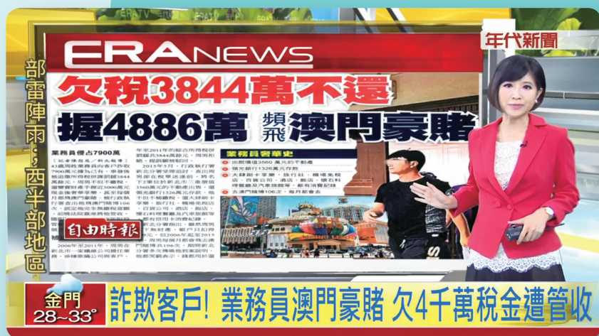
▲ 107 年 7 月 18 日年代新聞

周男更被本分署查出有將銀行鉅額存款提領一空，隱匿資產情事，經限期命其履行義務及報告財產狀況，周男竟仍佯稱其沒有財產，無能力還錢，本分署最後決定採取強制處分，向法院聲請裁定管收獲准，周男因欠稅被管收，嚐到失去自由的滋味，只好聯繫其家人幫忙籌錢繳納，獲得釋放。