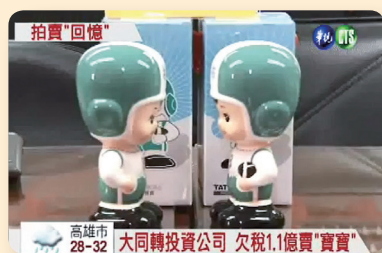
▲ 100 年 8 月 4 日擘視新聞

拍賣當日，吸引大批對「大同寶寶」有無限回憶的粉絲迷及收藏家競標，當中，一只「綠色」且胸前有「66」字樣，高 37 公分，最具收藏價值的大同寶寶，因為數量稀少，據說市場收藏價行情，喊價到新臺幣 4 萬元，沒想到，經過一陣廝殺喊價競標，最後，是由一位張姓收藏家，以 7.8 萬元搶標成功，創下大同寶寶天價成交紀錄。