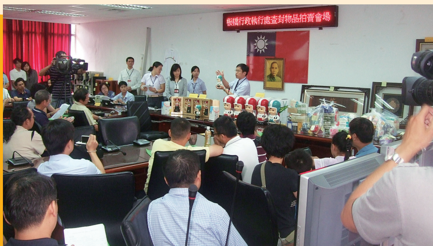
▲ 本分署查封物品拍賣會，拍賣物品包括「大同寶寶」。