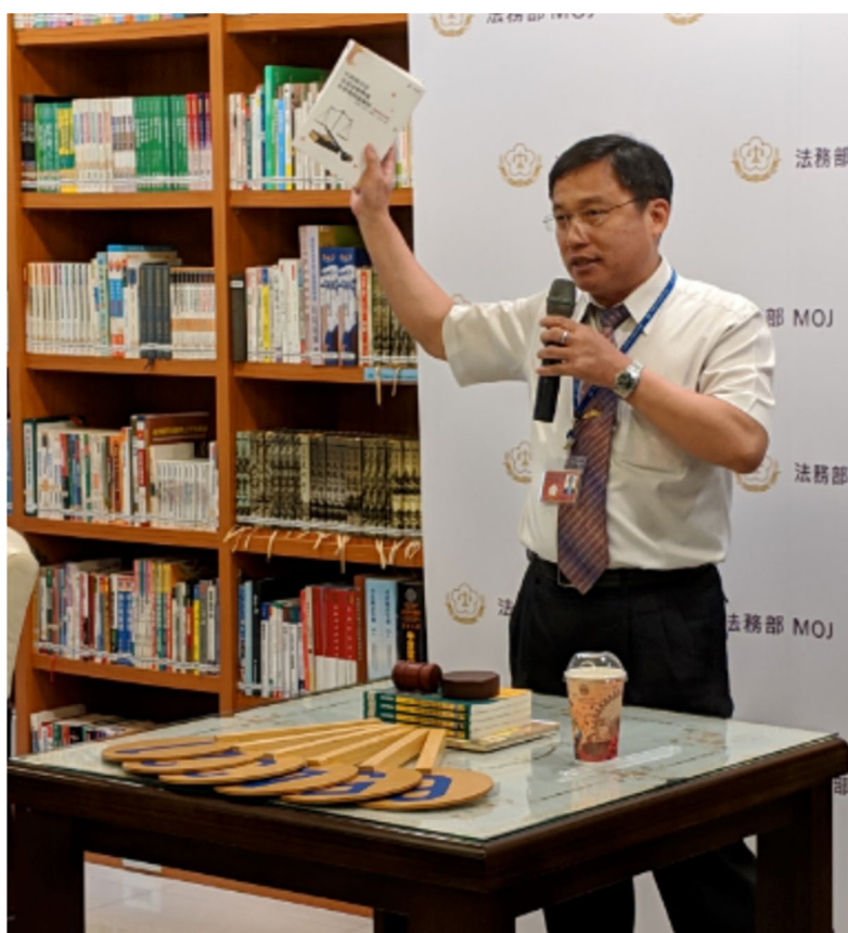
黃執行官有文示範精彩拍賣過程