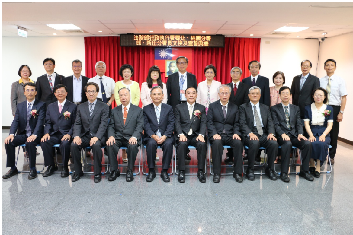
蔡部長清祥(中)與出席交接典禮貴賓合影