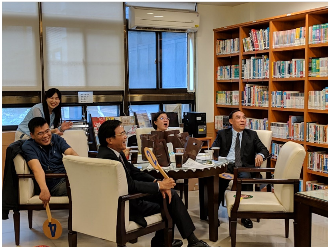
媒體、蔡政次、楊主秘、蔡部長欣賞拍賣官精彩叫賣示範