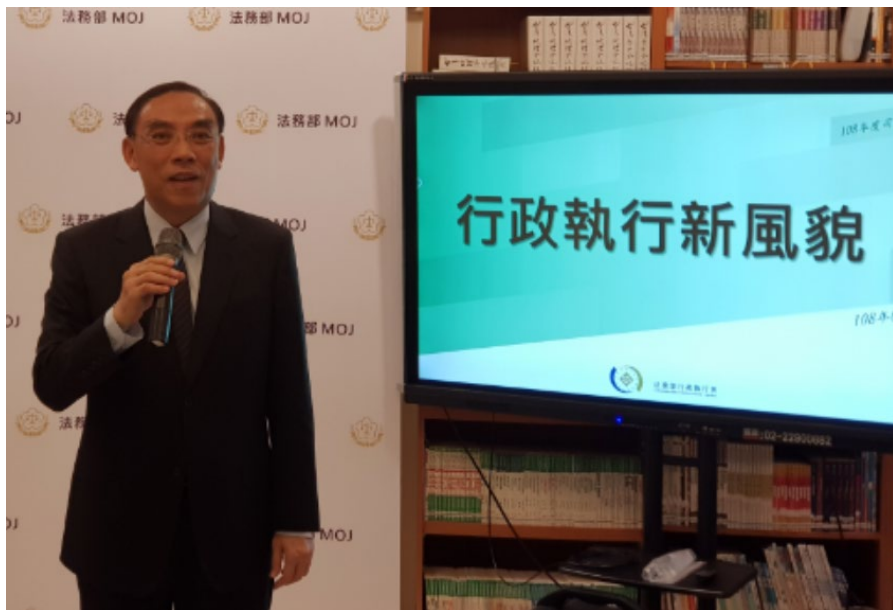
蔡部長主持司法記者小茶敘

蔡部長清祥於108年5月29日下午3時於法務部2樓閱覽室親自主持每週三「司法記者小茶敘」，由本署報告「行政執行新風貌」。部長盛讚執行署同仁年輕有朝氣，思維新穎，將本是枯燥、讓人憎惡的追償罰鍰業務，以散播活潑、關懷的熱情，設計出全國轟動的123聯合拍賣日，有讓外界矚目的績效，也有對弱勢的關懷，創造雙贏。林署長慶宗在簡報中強調，行政執行機關除了以新的創意展現績效長紅，對欠稅大戶絕不手軟，也不罷手，並以暖男形象有溫度的跟民眾催繳、跟民眾搏感情。陳副署長盈錦接續簡介執行手段、守護公義、關懷弱勢、除民怨及廣受民眾矚目的123聯合拍賣的小故事。茶敘安排新北分署義務人到場製作手搖飲料，讓媒體感受執行分署提供平台協助義務人以拍(變)賣產品方式換取貨款，償還欠繳金額的溫馨作法。並請最會炒熱氣氛的拍賣官-黃有文行政執行官現場示範精彩的叫賣，贏得媒體一片掌聲。