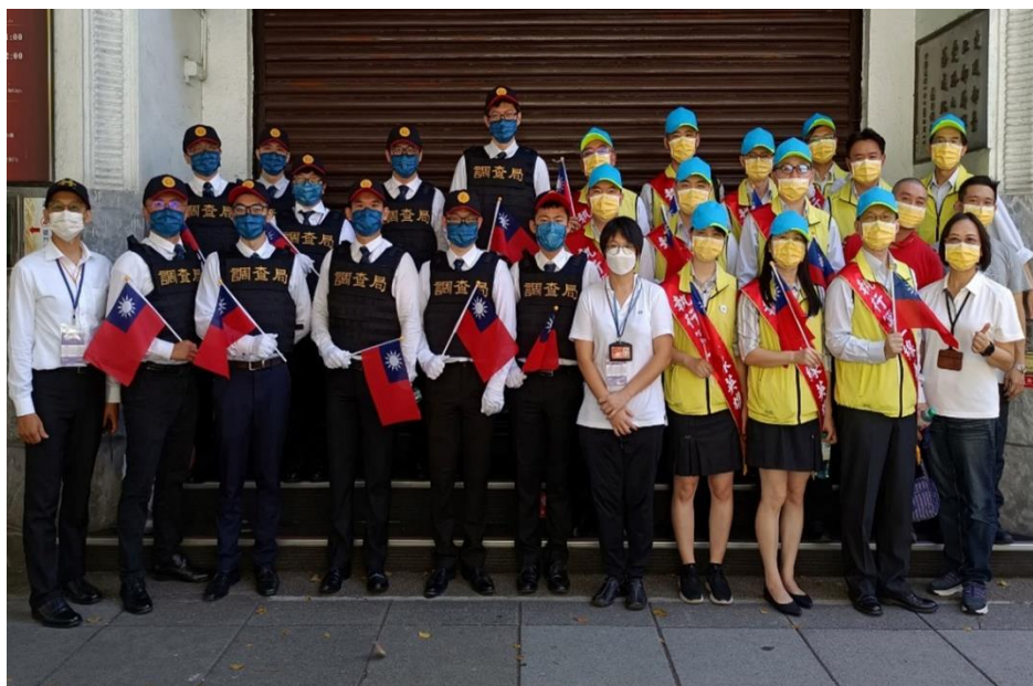
管制官、全體有功人員及工作人員合影