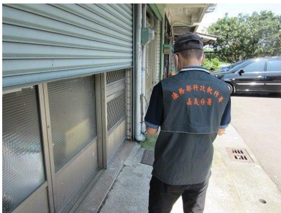
嘉義分署到補習班現場執行照片