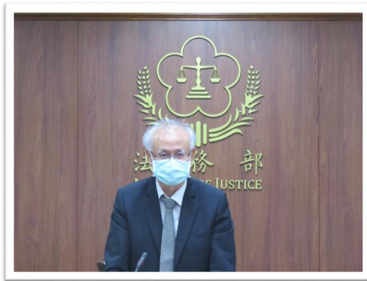
張常次斗輝主持司法記者茶敘

在檢察機關人力、資源有限之情況下，由檢察官視案件情狀，於必要時依法囑託行政執行分署協力進行扣押物變價事宜。自刑法沒收新制實施以來，行政執行分署受檢察機關囑託辦理扣押物、沒收物之變價案件，累計約80餘件，累計變價金額新臺幣6千餘萬元，著有成效!行政執行分署受囑託辦理諸多變價案件，運用專業與經驗，有效執行，協助追討犯罪不法所得，提升行政執行機關之價值，貫徹實現公益任務。且在雙方人力、資源有限之情況下，通力合作執行，發揮法務部檢察及行政執行體系橫向聯繫之綜效，樹立合作標竿。