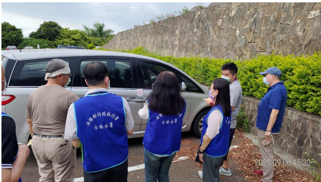
士林分署執行防疫專案到淡水揮皇高爾夫球場查封車輛

為落實政府防疫政策，確保防疫無缺口，守護全民健康並彰顯公權力，本署及全國13分署，對於違反防疫規定拒繳罰鍰之違規者，自110年8月17日至9月16日，實施第4波「強力執行滯欠防疫案件罰鍰專案」，並於9月16日動員執行人員639人次，分赴311處所現場催繳、執行，總計查封土地32筆、建物4間、汽車9輛、機車或貴重物品16件、限制出境9人、充分展現政府防止嚴重特殊傳染性肺炎(COVID19)病毒入侵及對違反防疫規定民眾執法之態度與決心。