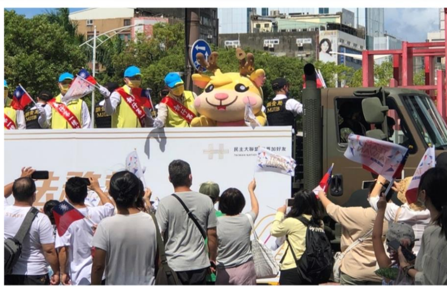
吉祥物拍寶及有功人員深受民眾喜愛

可愛臺灣梅花鹿人偶「拍寶」，是行政執行署的吉祥物，非常活潑的揮舞著大國旗、大法拍槌，同時逗趣的向兩側民眾揮揮手，超萌Q的，深受現場民眾喜愛！穿著黃色背心的是各分署執行有功人員代表，非常歡愉地向民眾揮揮手、搖國旗致敬，受到民眾夾道歡迎。各分署執行人員是執行欠稅罰鍰案件的無名英雄，在對抗新冠疫情、防堵非洲豬瘟上功不可沒，努力為國人堅守最後一道防線，共同維護國民健康，守護美麗的臺灣！