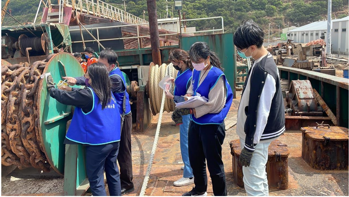
查封抽砂船錨機及錨鏈設備