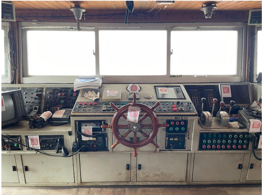
查封抽砂船指揮中樞駕駛台、導航、監控等儀器設備