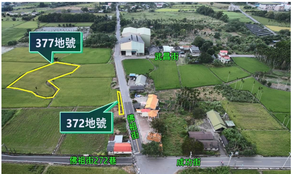
(無人機空拍影片：花蓮縣光復鄉土地)