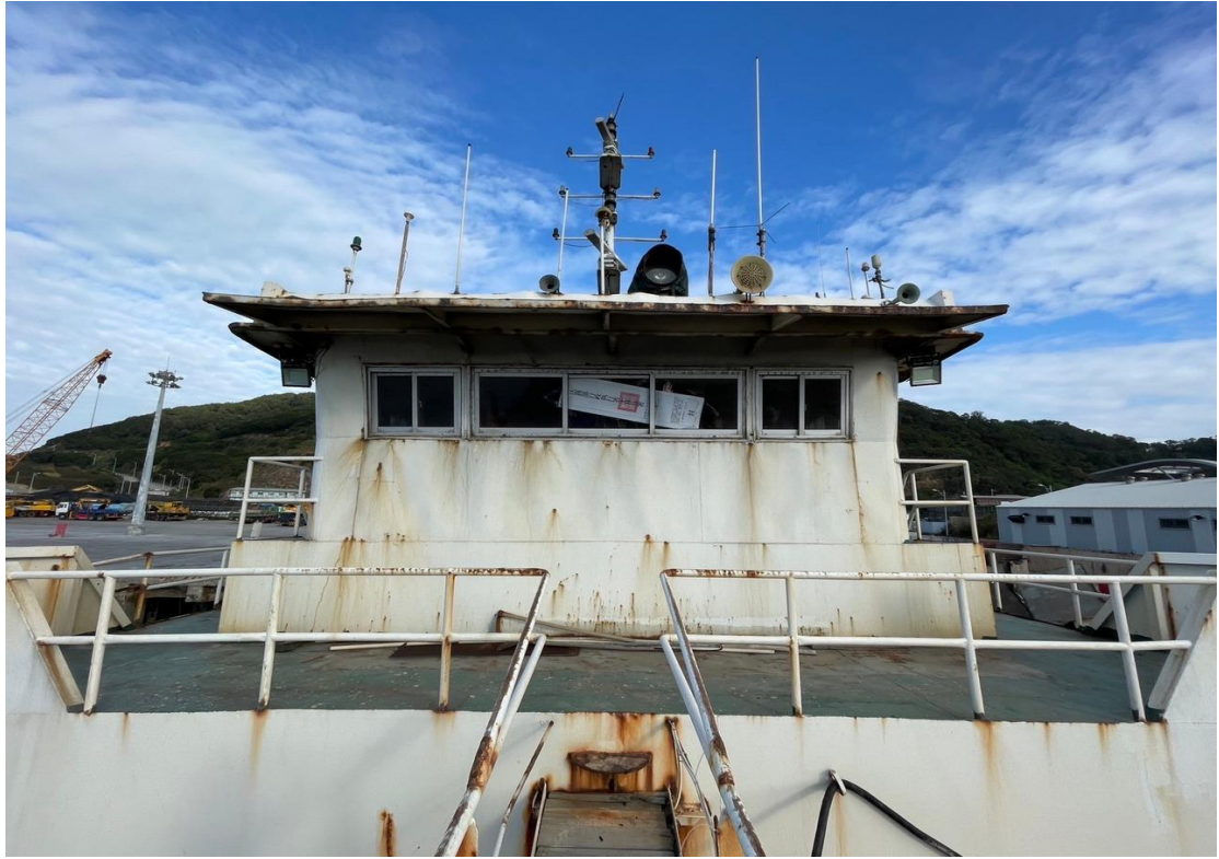
查封「展盛 98 號」抽砂船