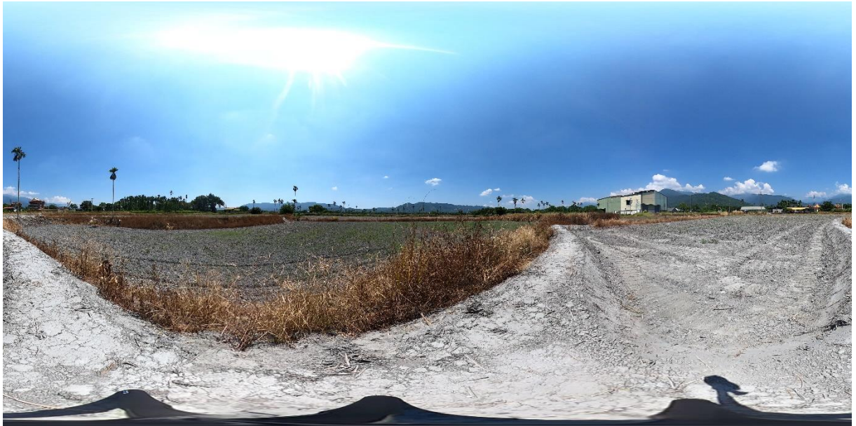
(花蓮縣光復鄉土地 360 度環景照片-377 地號)