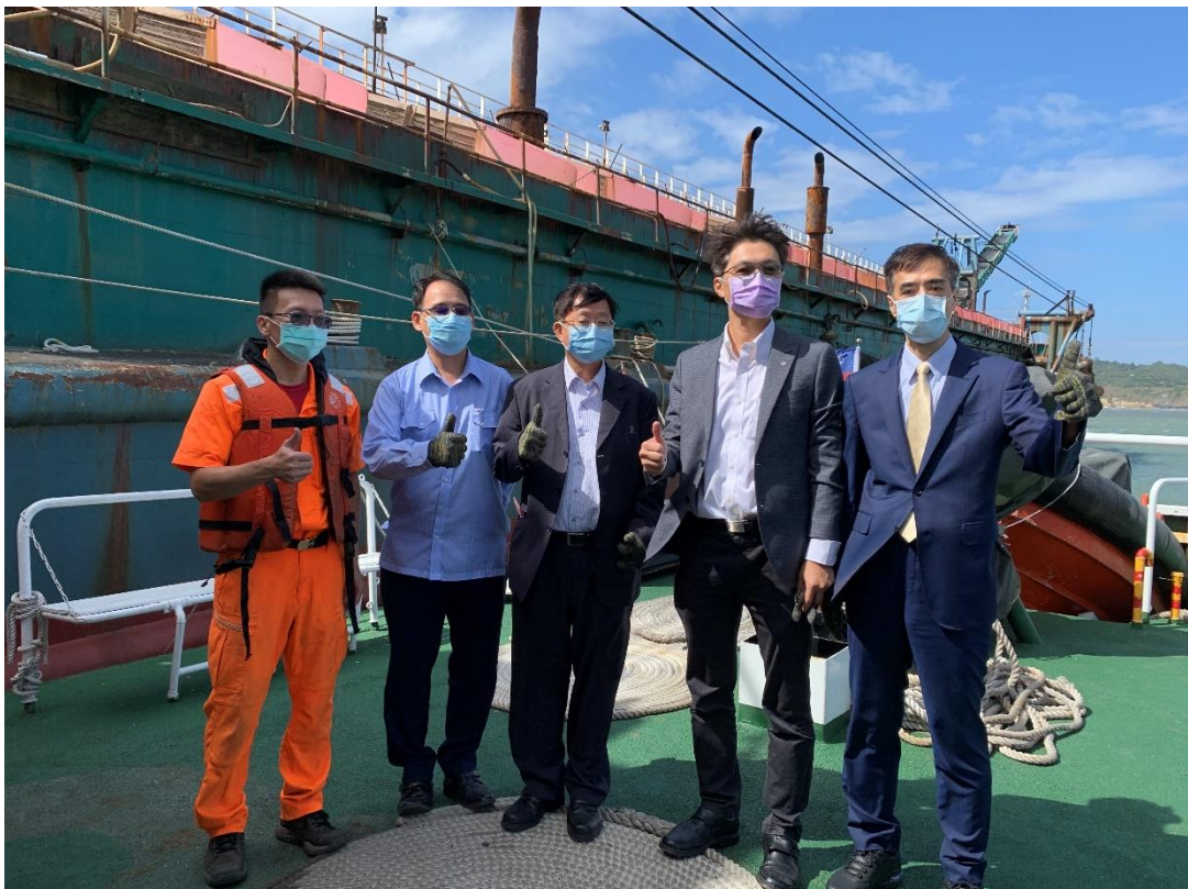
檢察機關、執行機關及海巡機關連袂登船查驗「展盛 98 號」抽砂船