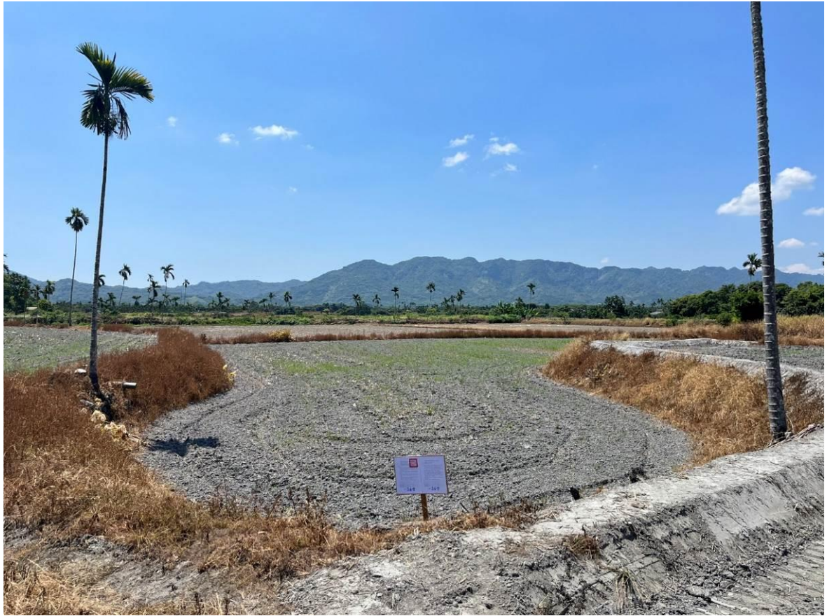
(花蓮縣光復鄉土地平面照片-377 地號)