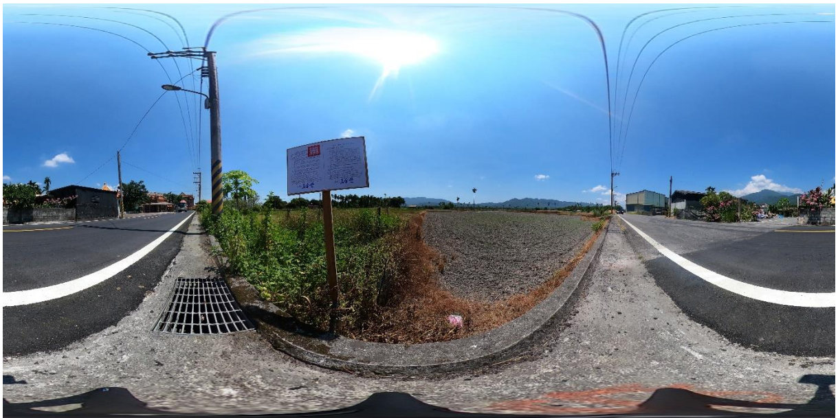
(花蓮縣光復鄉土地 360 度環景照片-372 地號)