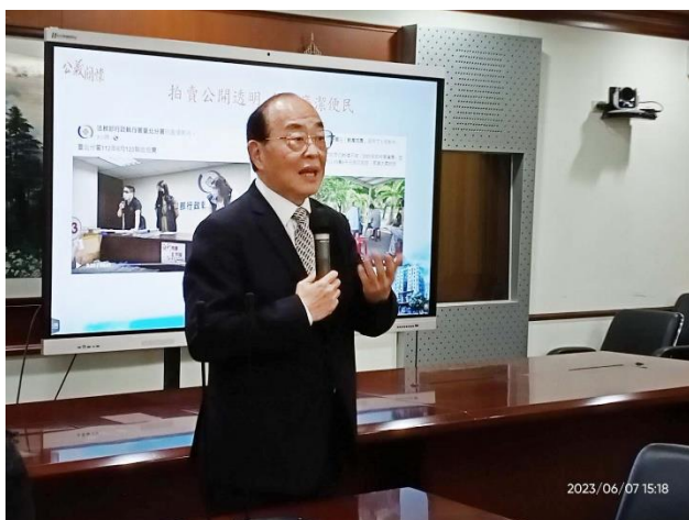
黃玉垣署長進行簡報

最後，面對現今社會環境瞬息萬變，科技如光速般飛快前進，科技創新已逐步取代傳統模式，執行工作的挑戰與困境紛至沓來，執行同仁將持續秉持「公義與關懷」核心價值，落實「科技創新，公開便民，執法效能」的執行理念，努力以新科技及創新思維再精進，齊心努力，達成國家賦予行政執行機關的任務與使命。