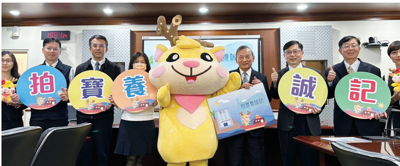
法務部陳政務次長明堂於「拍寶養誠記」發表會與大家合影

宣導活動由新北分署於 112 年 2 月全台首站開跑，後續高雄、臺中、士林及桃園等分署接力進行，而宜蘭、屏東、嘉義、臺北、花蓮及彰化等分署長亦帶隊深入在地國小，與學童進行面對面互動，並透過多元宣導內容之安排，藉由寓教於樂的活動與遊戲，將法令遵循及誠信廉潔等正確價值觀深植校園，讓品德教育變得輕鬆有趣，亦有學童在課後寫下學習心得，如「我覺得要誠實，因為誠實有很多機會，但不誠實就沒有機會」及「我很喜歡今天的故事」等語，宣導活動後校方以致贈感謝狀、臉書刊登活動花絮影片等方式以表感謝，顯見活動深獲學童及師長之肯定及讚賞，而有效將誠信理念潛移默化於學童心中。