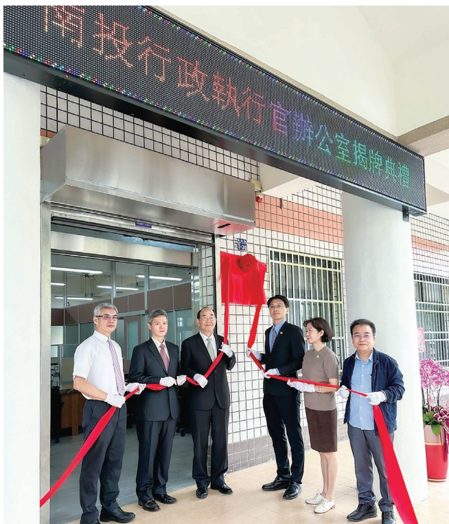
揭牌典禮由黃署長玉垣親臨主持

黃署長致詞時表示，南投是個好山好水、地靈人傑的好地方，非常適合上班與居住，而新的南投辦公室能在這麼好的地方成立，建築也俱有中西合璧特色，是中央與地方共同合作的成功典範，也是跨部會合作的超前部署，同時南投辦公室也有更方便、舒適的空間來服務民眾。