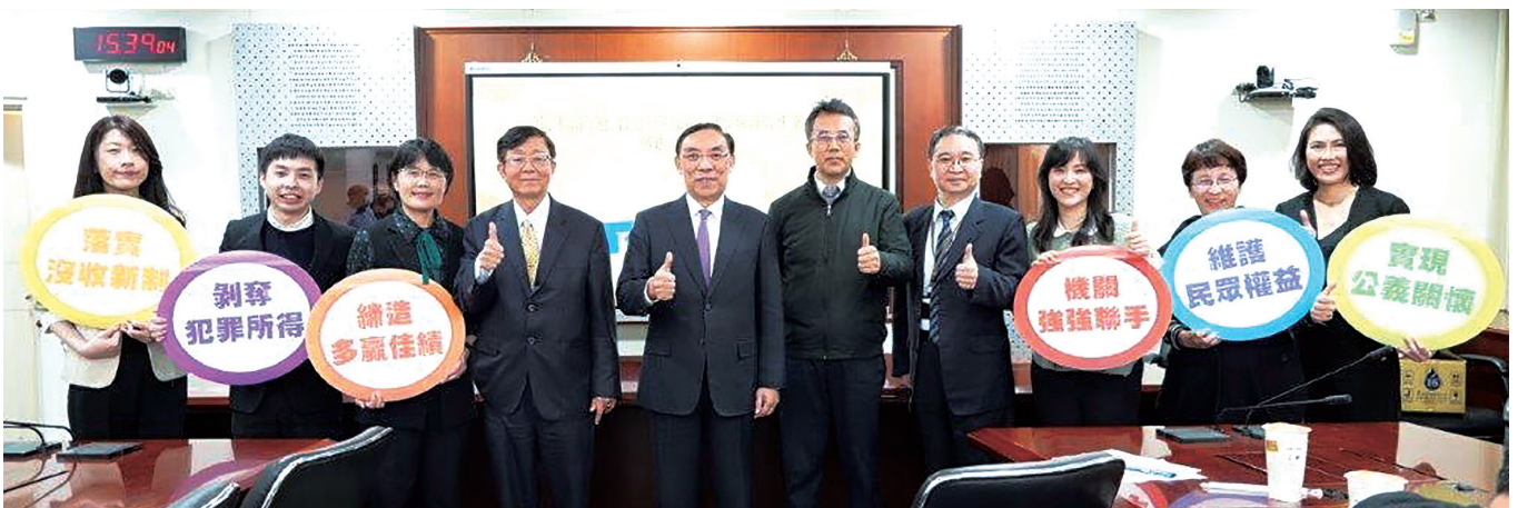
新竹分署於司法記者茶敘後發表「紅富海吸金案」犯罪不法所得變價成果

除此之外，本件苗栗地檢署囑託新竹分署變價雖僅有 3 案，但新竹分署總計拍賣、變賣金額竟高居檢察機關囑託執行之冠，甚至相關拍賣物件，在新竹分署善用巧思之推介下，其最終拍定金額高出底價甚多，溢價比屢創新高，其中最高之溢價比更高達 162.88%，打破「法拍即賤賣」之刻板印象，成果可謂卓著！