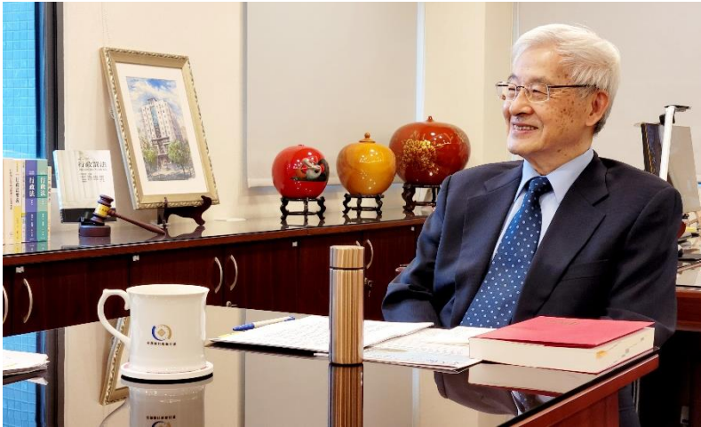
專訪廖義男前大法官