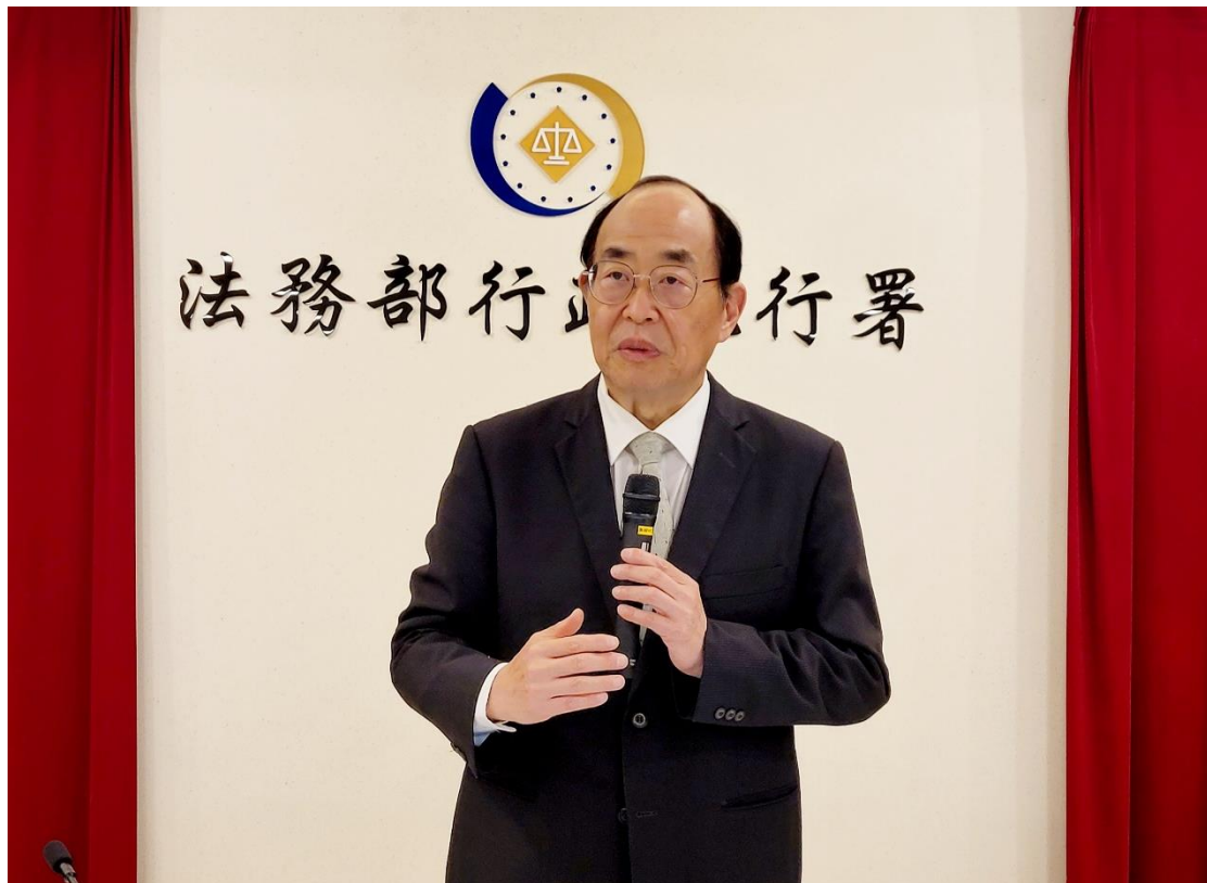
↑ 黃玉垣署長於會上致詞並肯定各分署亮眼績效