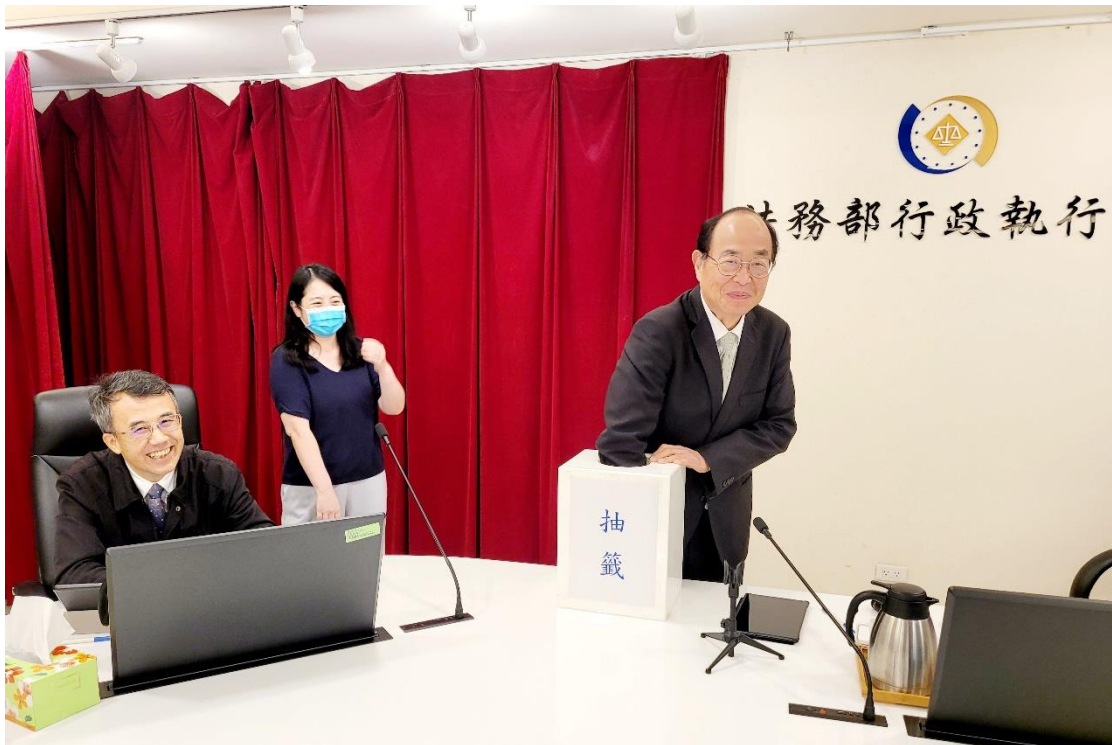
↑ 進行本署紀律委員會抽籤