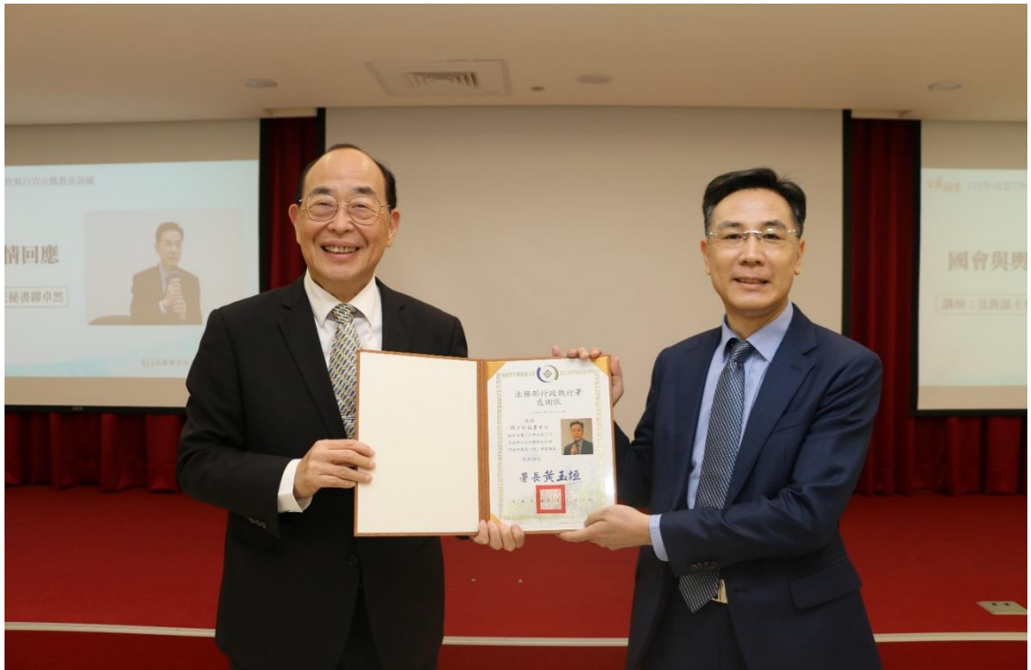
黃署長頒贈法務部繆卓然主任秘書感謝狀