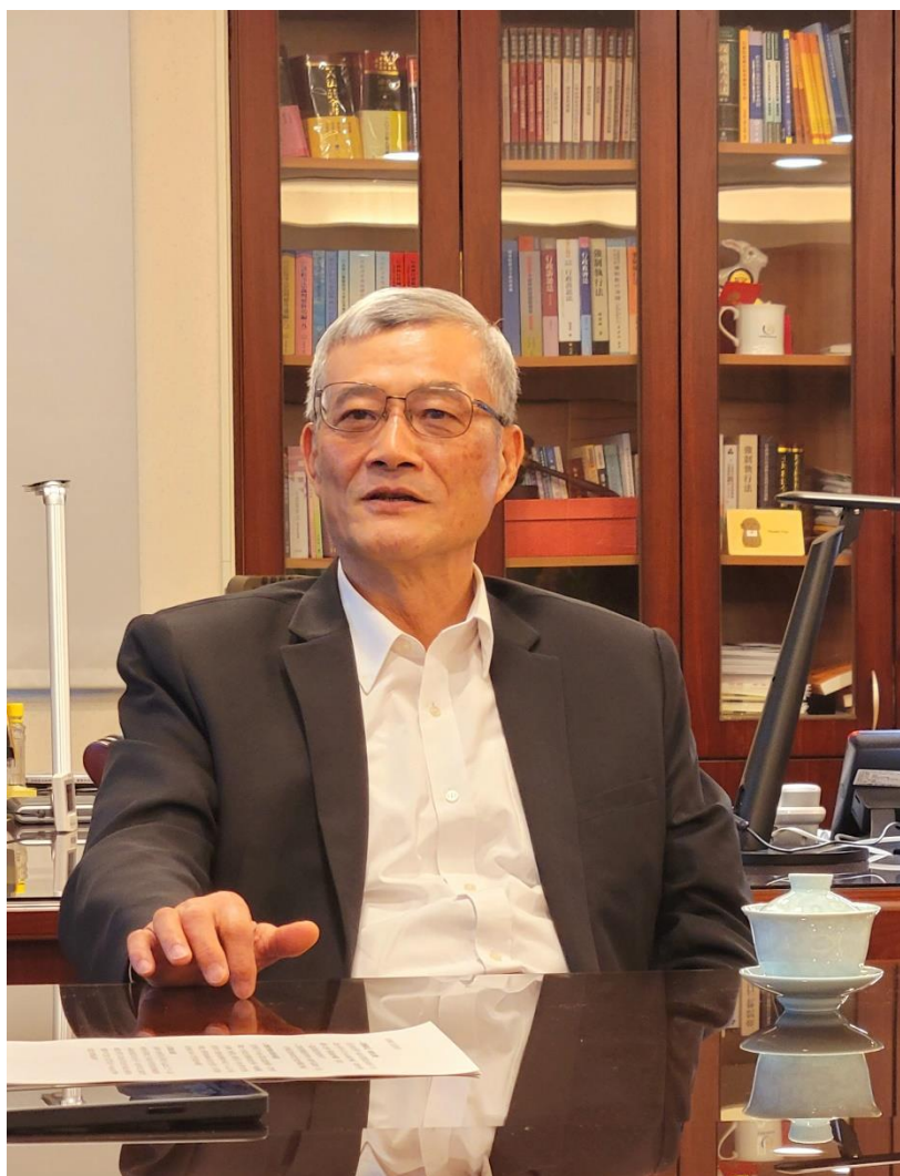
張主任檢察官清雲接受執行園地專訪 分享他擔任本署署長推動各項執行措施的發想過程與經驗

張主任檢察官清雲任職本署期間(99年7月28日至105年7月17日),完備各項行政執行制度與法令,積極實踐公義與關懷政策,行政執行業務績效屢創新高,張主任檢察官因而榮獲103年度公務人員傑出貢獻獎,本署非常榮幸邀請張主任檢察官就「《弱勢關懷政策》的發想及推動」、「面對執行績效起伏應有的態度」及「民眾陳抗的處理」等3個主題分享他的經驗及看法。