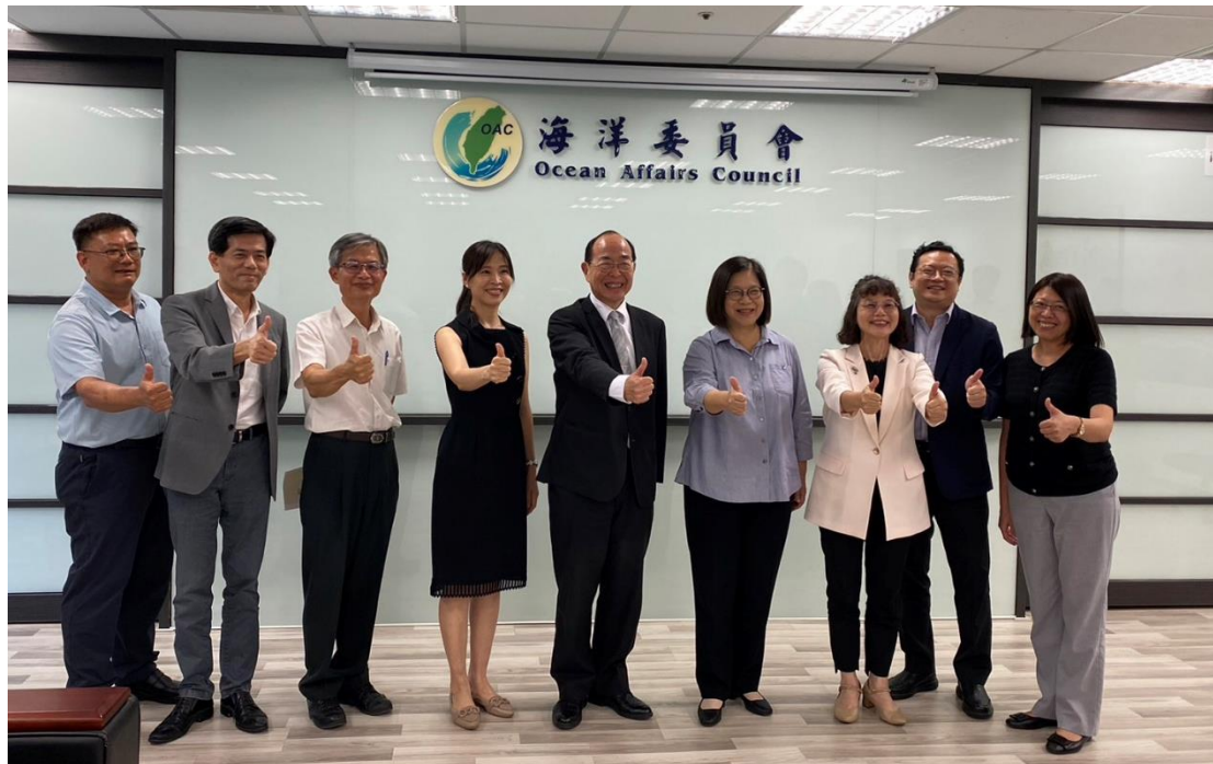
本署黃玉垣署長、高雄分署楊碧瑛分署長、屏東分署柯怡如分署長及3位(主任)行政執行官與海洋委員會管碧玲主委合影

本署黃玉垣署長率領高雄分署楊碧瑛分署長、屏東分署柯怡如分署長及3位(主任)行政執行官至海洋委員會拜會管碧玲主委，研商本署預訂於112年11月15日假高雄大學舉辦「國際研討會」之相關事宜，並邀請海洋委員會協辦，建立跨機關合作，共同推動國際學術交流。