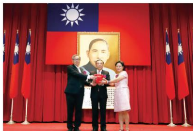
臺北分署分署長交接儀式

蔡部長肯定行政執行署各分署成立至今近 23 年，徵起金額已突破 6,400 億餘元，績效卓著。期許各位高階主管及分署長，應勇於承擔責任、以身作則，建立正確觀念，運用各種方法，使民眾瞭解遵守法律的重要性，保持積極態度，秉持「公義與關懷」核心價值，加強執行滯欠大戶。持續以創新思維與妥適應對作法，帶領同仁提升執行效率及服務品質，重視外界看法，回應各界要求，達成讓國人有感之施政目標。