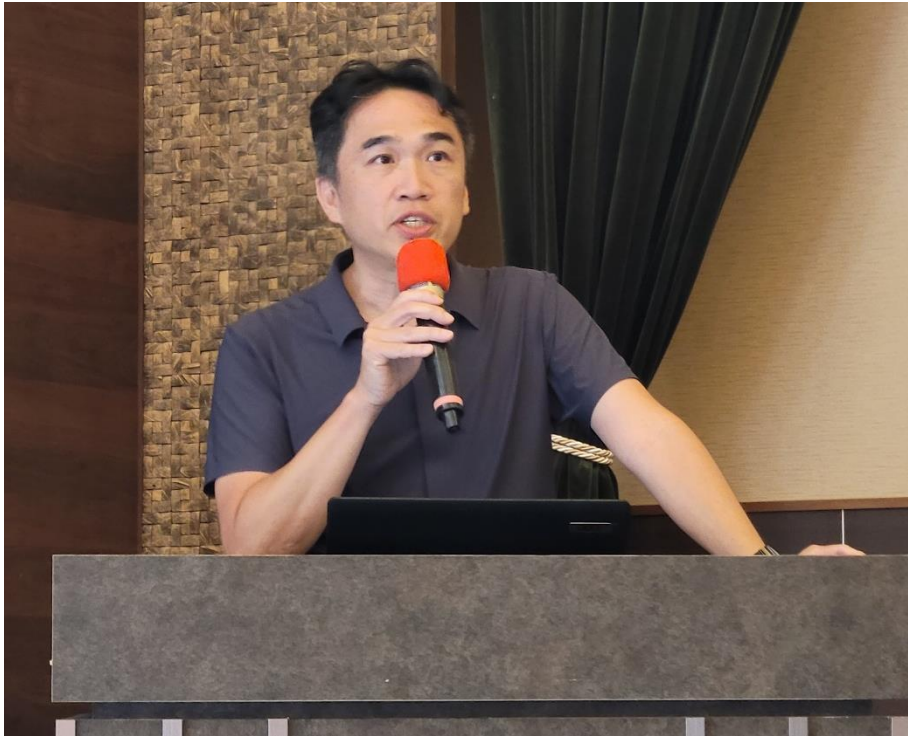
林主任行政執行官岡助以「主動出擊突破困境－以解決共有耕地自耕保留部分未辦理持分 交換移轉登記之拍賣爭議為例」為題進行專題演講