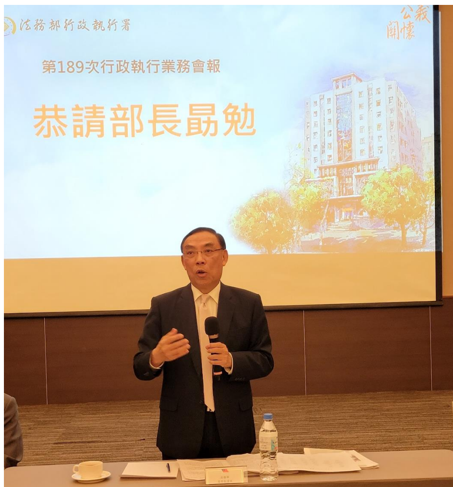
法務部蔡清祥部長親臨指導

隨後，蔡部長致詞表示，執行的目的是讓民眾遵法守法。酒駕及行人優先專案，應持續辦理。滯欠大戶的執行，最能得到民眾認同，有遏阻的效果，要繼續努力，並應落實對弱勢的關懷。蔡部長並強調，要建立正確觀念、積極態度、果斷決心及應對作法。「觀念」就是不追求數字，而是要追求民眾守法。「態度」是積極主動，要風險管理，積極發掘問題予以解決。「決心」則是依法貫徹執行。「作法」要合法妥適，並思考外界的看法，回應外界的要求。