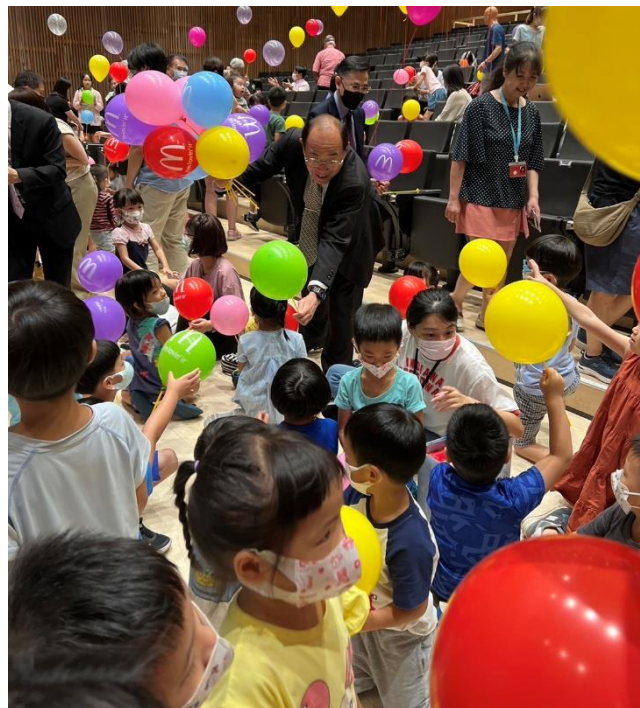
黃玉垣署長親切分送氣球給與會小孩