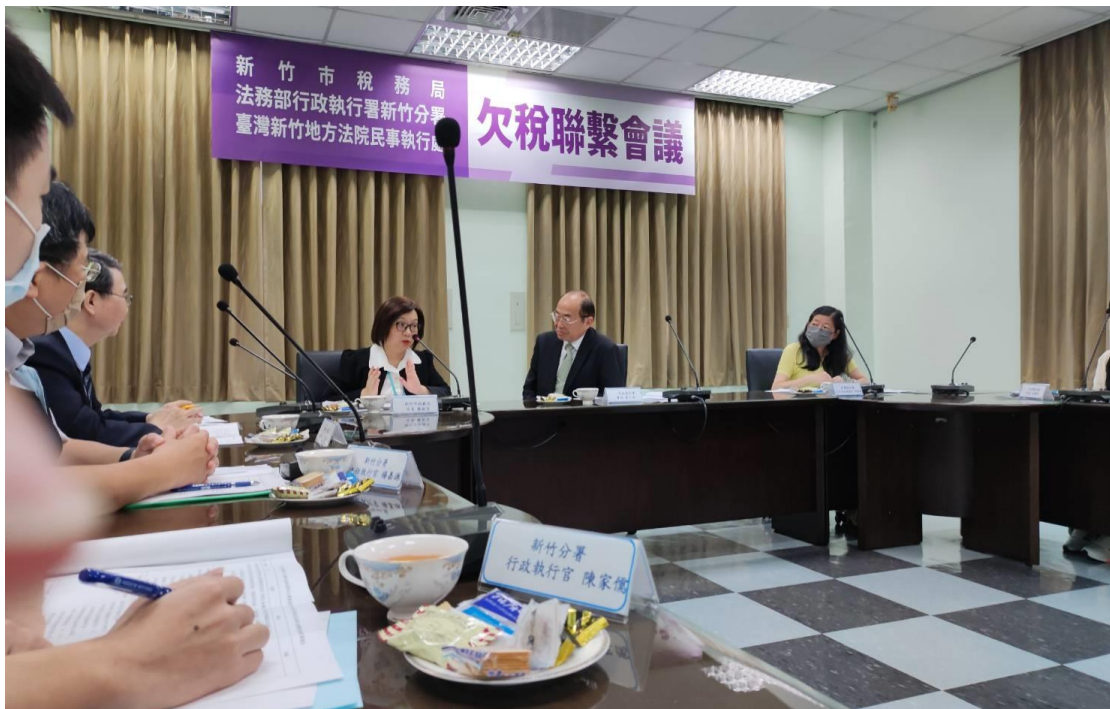
黃玉垣署長親臨會議現場，與新竹市稅務局及新竹地方法院民事執行處等達成三方合作模式之共識