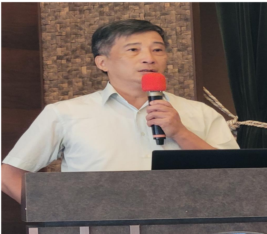
周主任行政執行官隆光以「機關溝通合作，共創多贏－以普案存款執行及滯欠大戶鉅額 欠費全額徵起之案例為核心」為題進行專題演講