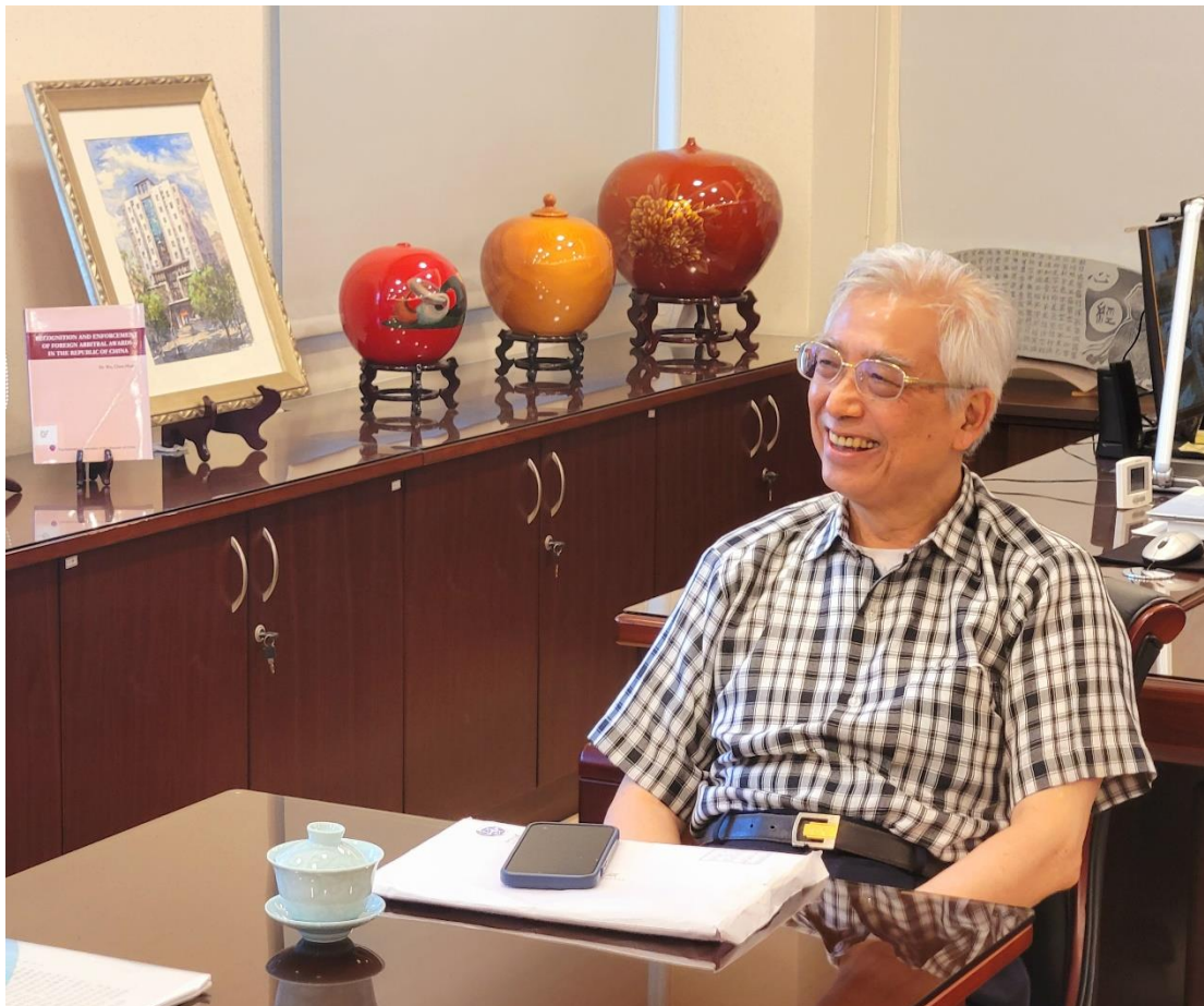
吳陳鏗大法官接受執行園地專訪，肯定執行同仁恪守職責、並發揮關懷弱勢同理心

吳大法官肯定執行同仁，有承擔責任的勇氣及恪守職責；執行的同時，也教育民眾守法觀念，對於惡意拒繳的民眾，要其付出相應的代價。此外，在執行過程中，以同理心考慮到弱勢民眾的處境，給予合理的分期繳納方式，甚至提供愛心社捐款，或轉介社福團體給予協助，展現人性光輝的一面。