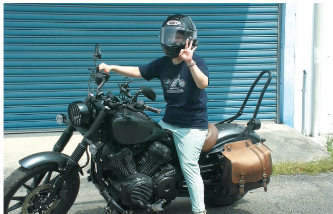
彰化分署查封拍賣之美式重型機車