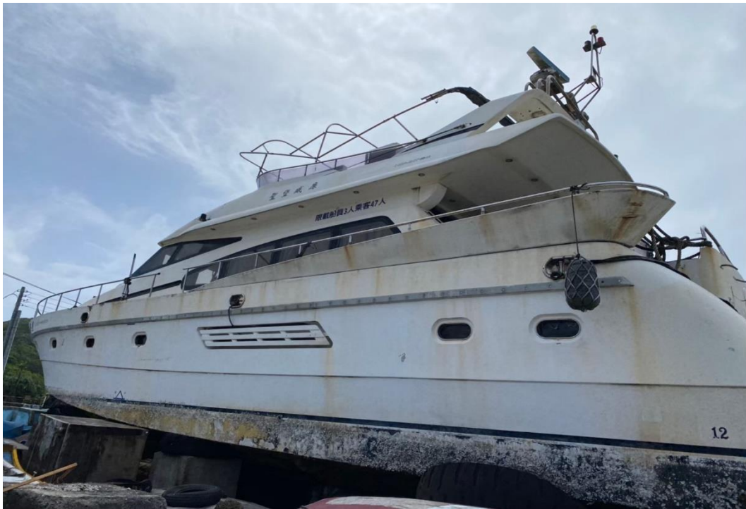
宜蘭分署受臺南地檢署囑託拍定船舶「聖堡威廉號」