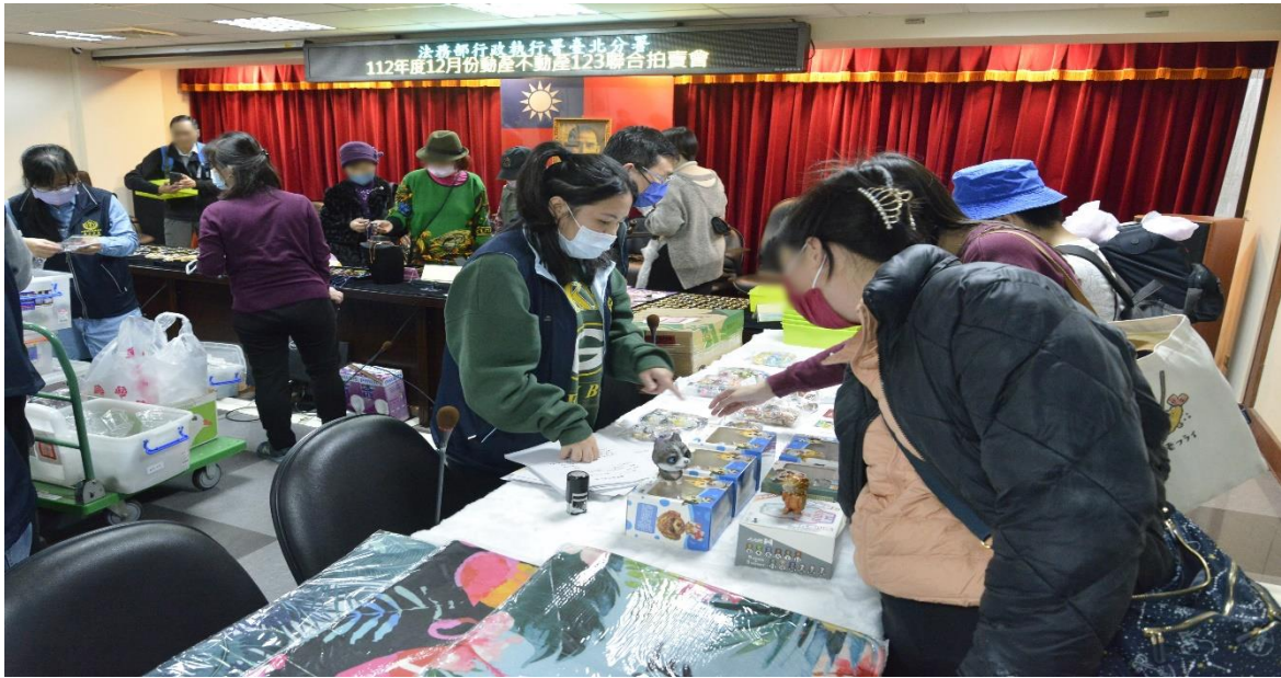
臺北分署變賣千件珠寶首飾