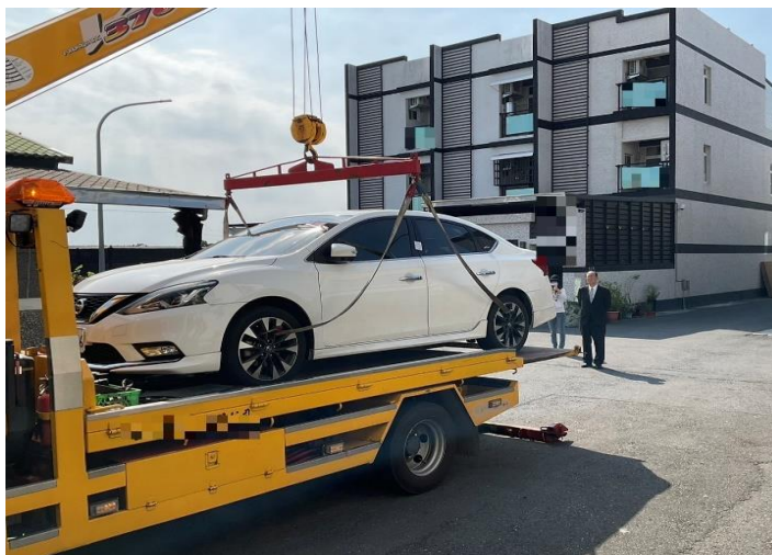
黃署長關心執行人員現場查封拖吊車輛情形