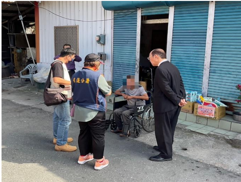
黃署長特地帶領花蓮分署愛心社社員至吳男家中探視並致贈物資

112年11月29日(星期三)彰化分署「愛心惜福義賣」所得，由黃署長與郭分署長景銘代表贈給彰化華山天使站