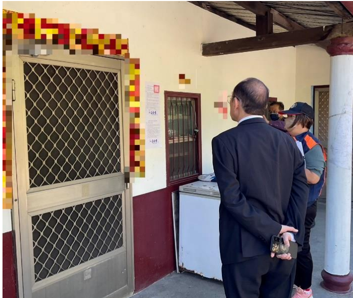
黃署長親赴執行第一線瞭解執行人員現場執行不動產情形

本署黃玉垣署長於本日赴臺東地區視察行政執行業務，並親自率領花蓮分署書記官謝佳宏、顏韋菱至第一線現場查封不動產、查扣車輛。另家住臺東縣卑南鄉一名吳姓男子滯欠健保費、機車燃料費及交通罰鍰等案，合計約新臺幣20萬餘元，其因雙腳缺血性壞死，於今年及去年曾住院動過兩次手術，以致行動不便，出入仰賴輪椅，無謀生能力，黃署長得知後，特地帶領花蓮分署愛心社社員至吳男家中探視並致贈麵條、罐頭、營養餅乾、衛生紙等生活物資。