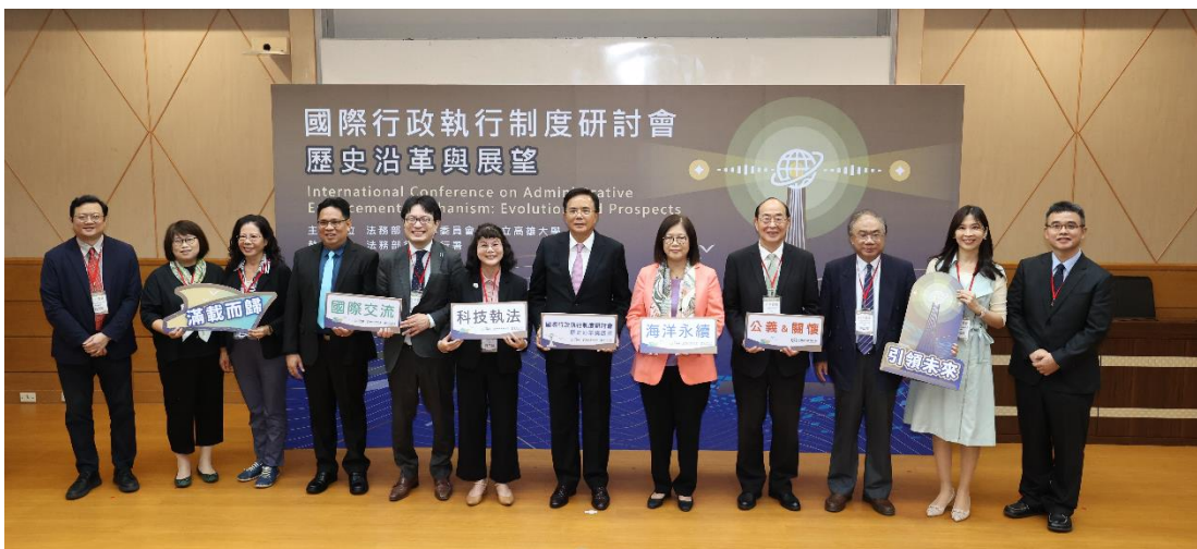
法務部蔡次長、海洋委員會管主委、高雄大學陳校長、本署黃署長與貴賓們合影