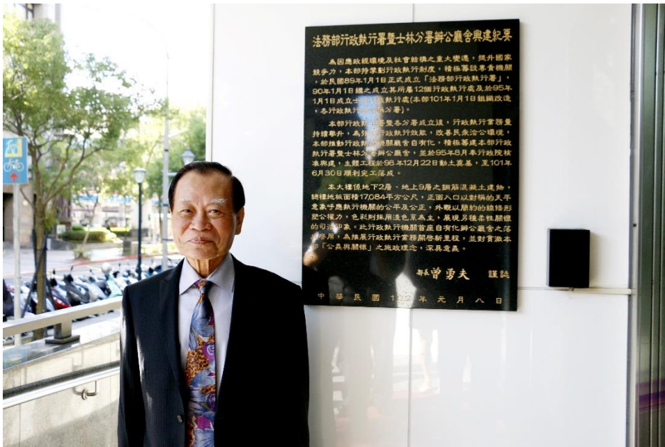
曾前部長與本署辦公廳舍興建紀要銘牌合影，在啟用滿10年的此時此刻，留下了別具意義的畫面。

曾前部長對本署及各分署於執行公義方面表現相當積極，如善用拘提、管收等手段，實現公法債權，不讓違法逃漏稅捐者逃避義務，造成不公不義的現象；對於檢察機關囑託的變價案件，亦是相當盡力協助。而在關懷弱勢方面的作為也很多，像是為弱勢義務人轉介社福單位尋求協助、轉介主管機關輔導考駕駛執照，甚至分署同仁還成立愛心社，以善款幫助亟需協助的困苦義務人，著實讓民眾感受到執法機關溫暖的一面。此外，本署近年對法治教育方面的努力，像是推廣法拍教學、發行拍寶養誠記繪本等措施，都是非常親民而柔性的宣導，在無形中能讓守法觀念深植人心，深切表達肯定之意。