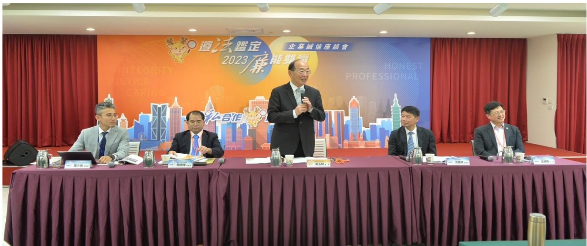
本署黃玉垣署長主持座談，邀請廉政署沈鳳樑副署長、士林地檢署顏迺偉檢察長、內政部地政司王成機司長及台北市不動產估價師公會鐘少佑理事長等人與談