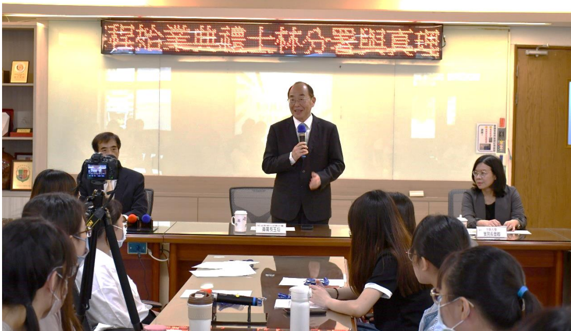
本署黃玉垣署長特別親臨主持始業式

本年度實習課程自 112 年 7 月 24 日起至 8 月 4 日止，為期兩週，本日實習課程開訓典禮，本署黃玉垣署長特別親臨主持始業式，署長致詞時，除對於參與本次實習課程 22 位同學們積極向學，追求法學理論與實務之真知給予期勉與鼓勵外，更勉勵同學們於實務實習期間多聽、多看、多問。另外，黃署長對該分署首次將虛擬實境 (VR) 技術運用在動產與不動產現場查封及執行拘提課程中，完整真實呈現執行過程深表肯定。