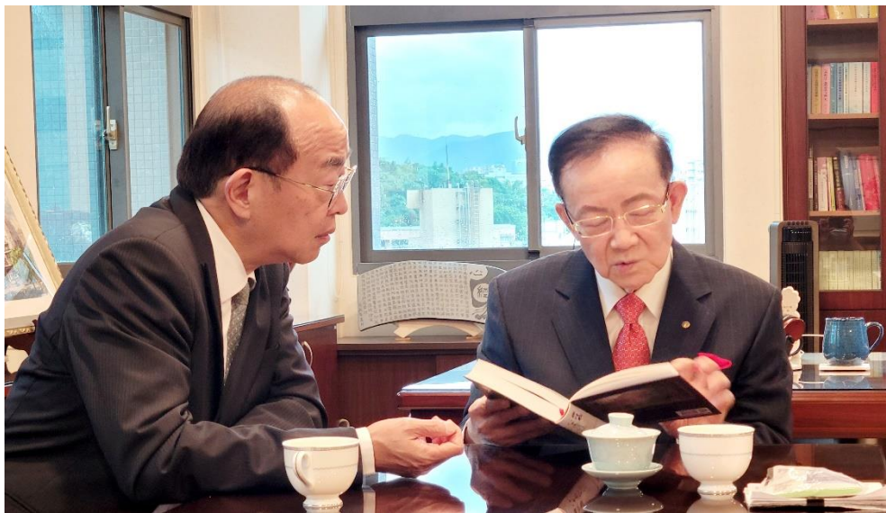
黃署長與城前副院長一起翻閱「八十歲月劄記」分享其投身臺灣法治人生歷程

經本署多次盛情邀請，城前副院長終於撥空來訪，適逢颱風來襲，仍無懼風雨依諾赴約，除以幽默風趣的口吻，分享在日本、歐美留學修習的時光外，並以嚴肅的口吻再次提醒，國家公權力係為維護社會秩序，增進公共利益所必要，但必須受到法律的拘束，此之「法律」並非僅為形式上的法律，亦包含實質上的法律，即一般法律原則及其內涵，以展現對人性尊嚴的維護。黃署長特別精心安排署內中興法商(現為臺北大學)校友們(城前副院長曾擔任該校法律系系主任)一起會面敘舊，他憶起於學校任教期間，邀請授課的同學到家裡來包水餃，為避免食量大的男同學們餓肚子，凌晨親自烹飪真材實料的酸辣湯、玉米濃湯餵飽 60 幾位學生的趣事，還感性地吟唱起老歌，悅耳動聽，最後並以其座右銘「un to full-grown man 出自《新約聖經》，意指努力學習成為一個充分成長的人)」激勵大家在生活中讓自己的人品修涵、學問滋養，充分並繼續不斷地成長。