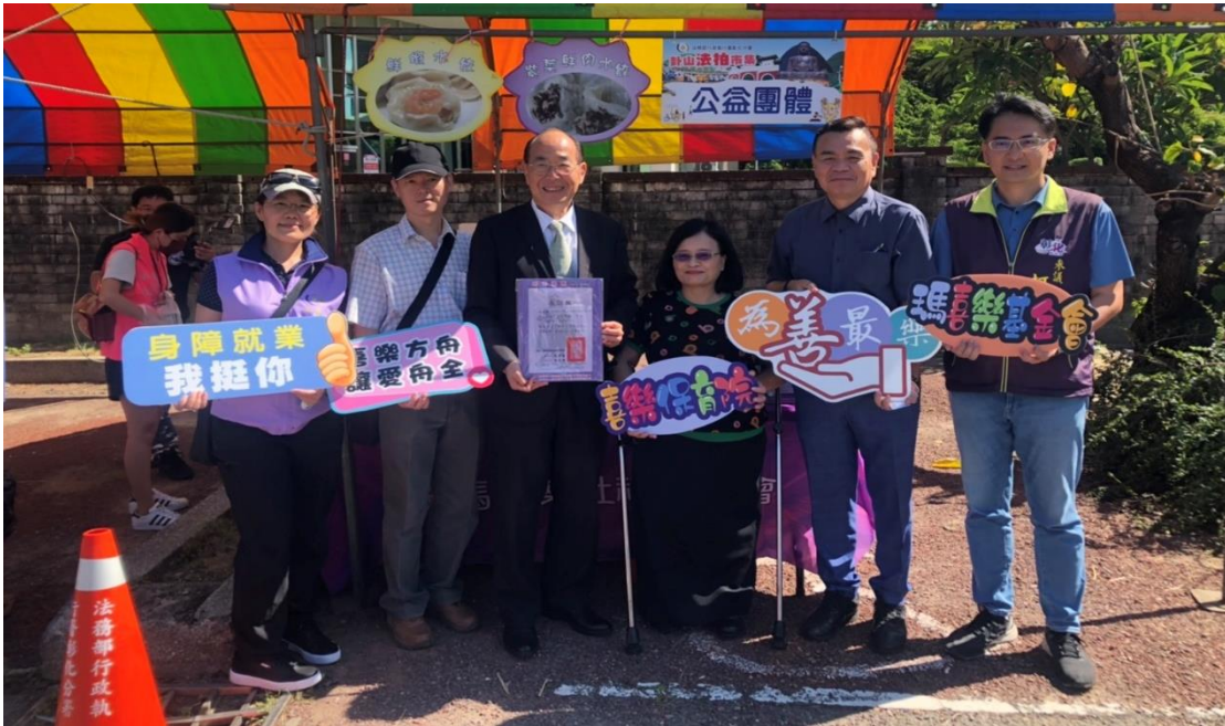
黃玉垣署長親自參與彰化分署「卦山法拍市集」為執行同仁加油打氣

彰化分署於本日上午盛大舉辦集食衣住行於一身的「卦山法拍市集」拍賣會，黃玉垣署長特地南下親臨拍賣現場，除給同仁加油打氣外，並關心前來一起設攤增加買氣的義賣公益團體。拍賣會現場約近千人參加本次法拍會，並有117人入場競標，喊價區座無虛席，所拍賣之汽、機車、玉石首飾競標激烈，共計入帳36萬9,380元，前來設攤的彰化看守所也捐贈喜樂保育院50組手工香皂，該分署愛心社也購買喜樂產品，一起共同關懷弱勢。