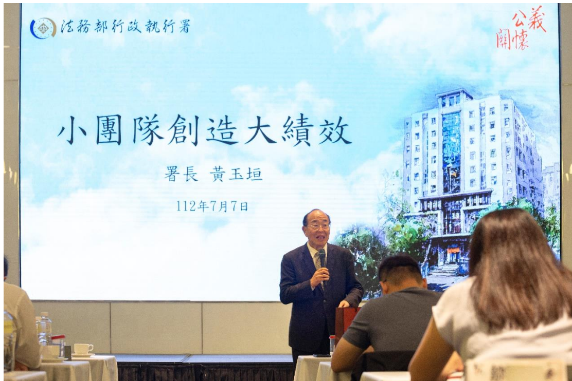
本署黃玉垣署長受邀至高雄大學EMBA中心演講

黃玉垣署長於本日下午1時至3時受邀至高雄大學EMBA中心舉辦之「高雄大學堂」系列課程進行演講，演講主題為「小團隊創造大績效」，透過影片及案例介紹行政執行機關業務與成效，以生動活潑方式讓在場學員留下深刻印象。