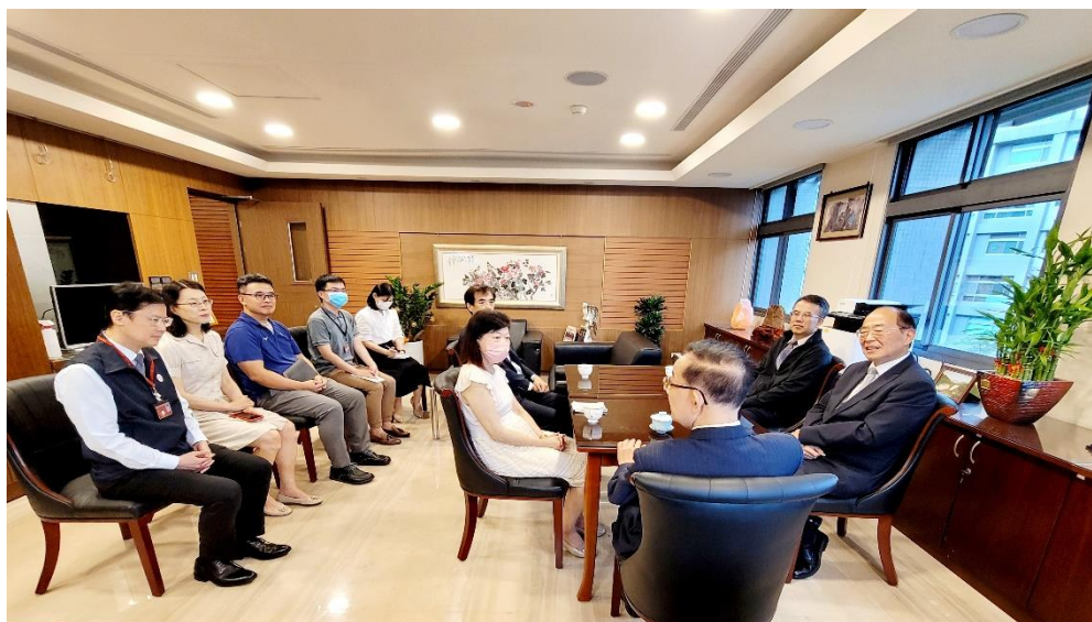
黃署長特別精心安排署內中興法商(現為北大學)校友們一起會面敘舊