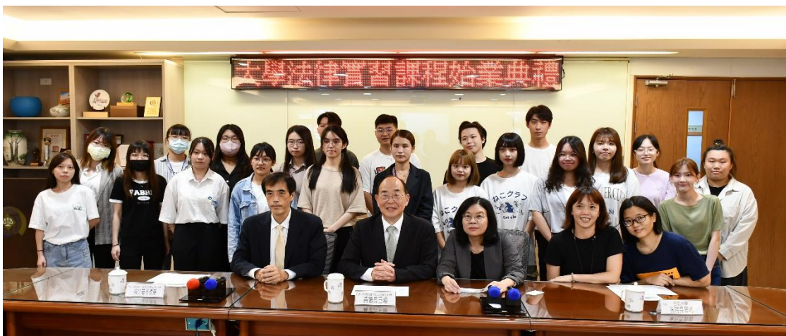
與參與本次實習課程 22 位同學合照