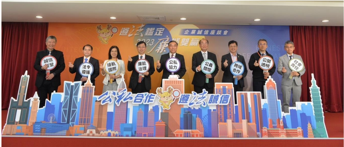
本次座談會邀集法務部廉政署、士林地檢、內政部地政司及不動產估價師業界代表，進行跨域對談交流，有效凝聚誠信遵法共識，建構反貪腐夥伴關係