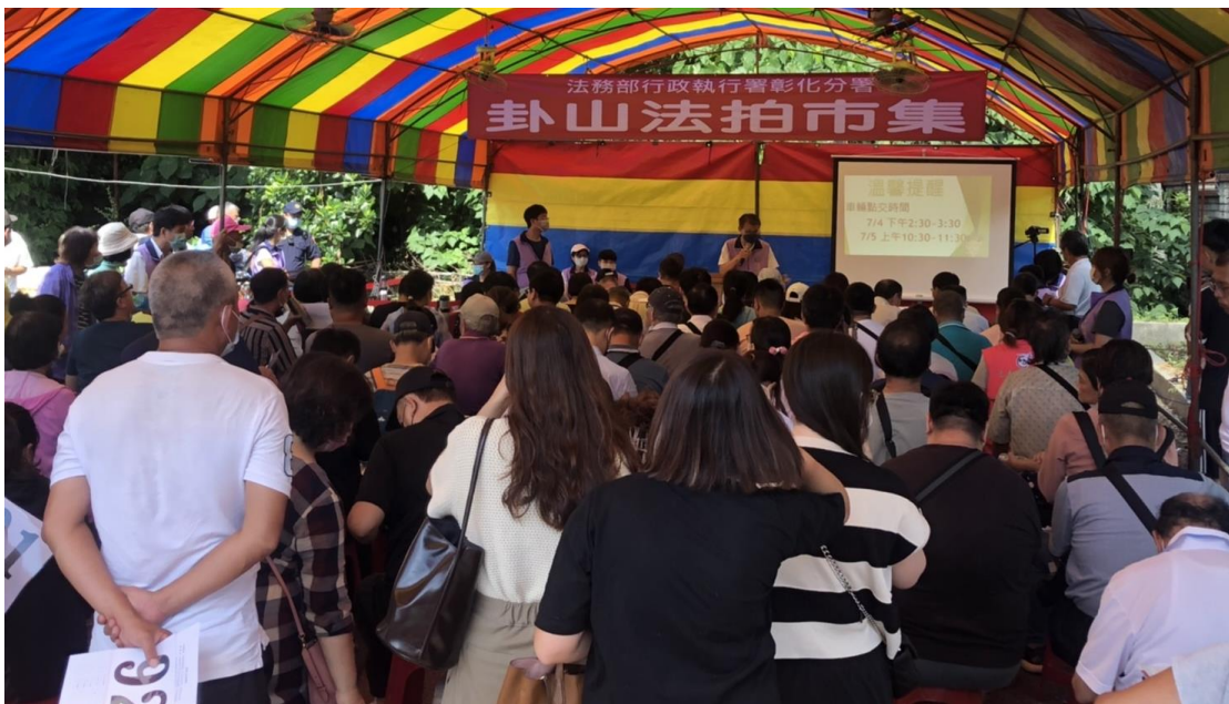
彰化分署「卦山法拍市集」滿滿人潮參與競標