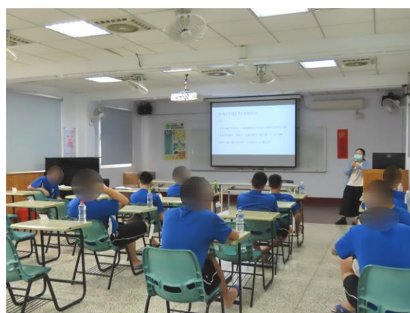
▲學習覺察自我內在想法