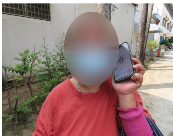
▲少年家長接收活動語音內容