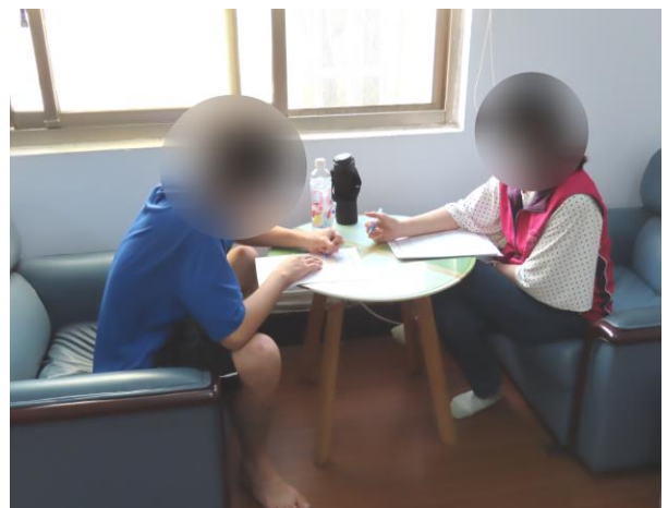
▲毒品少年個案銜接輔導