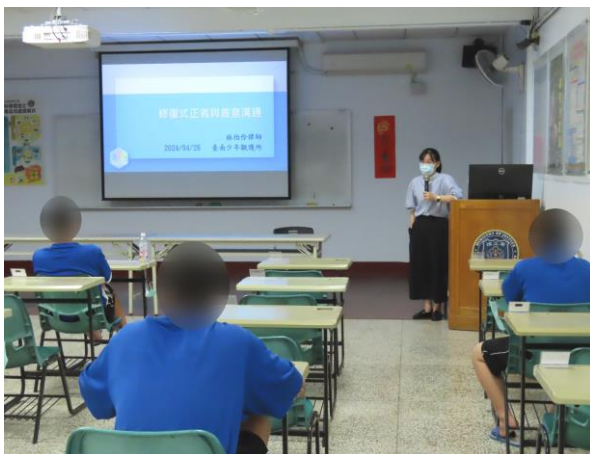
▲林律師修復式正義與善意溝通宣導

4月26日15時至16時，與財團法人法律扶助基金會台南分會合作辦理法治教育宣導，邀請林律師擔任講師，進行修復式正義與善意溝通之宣導，計有少年19人次參加。