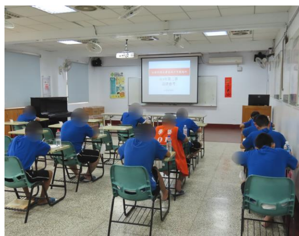
▲少年認真完成作答