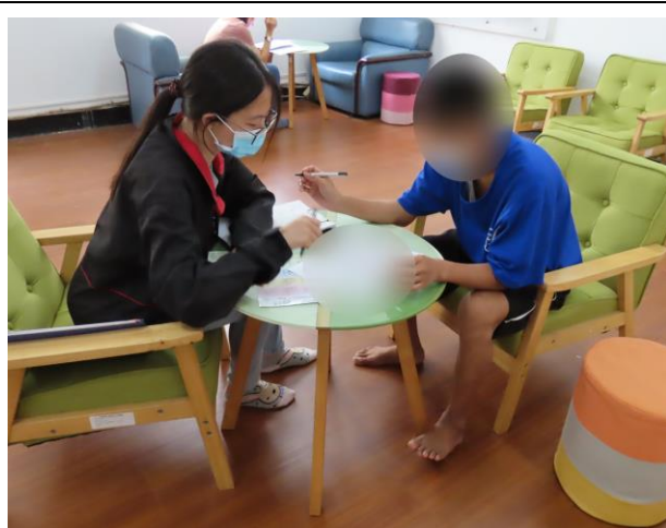
▲協助少年未來返校及就業服務