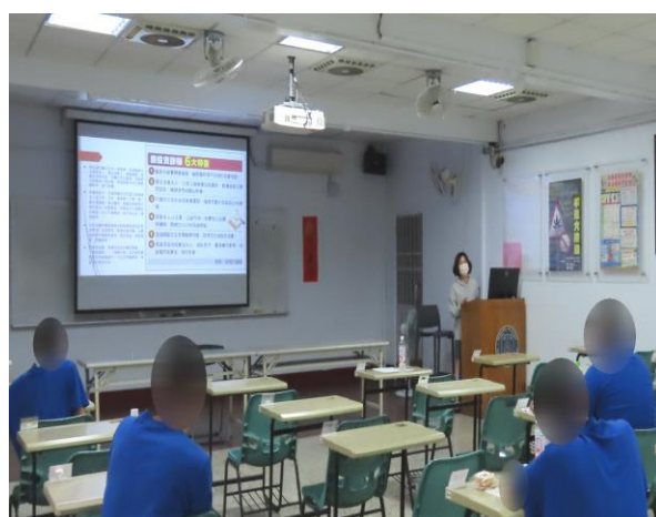
▲避免少年涉入詐騙之陷阱