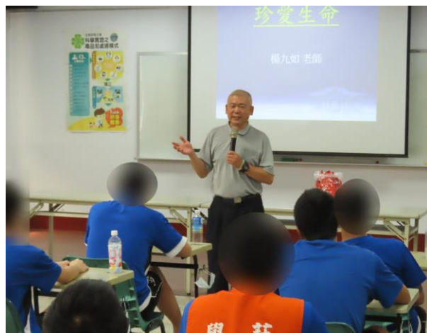
▲楊老師與少年們進行生命分享故事