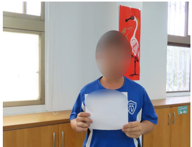
▲少年得到家長關心之訊息