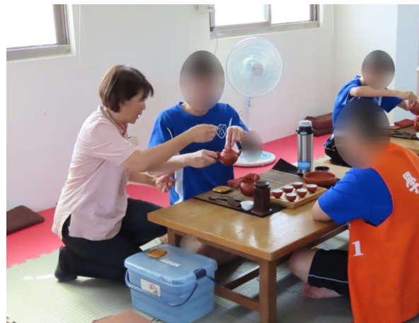
▲指導少年茶道禮儀