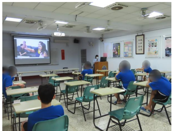
▲透過影片分享修復式之涵義