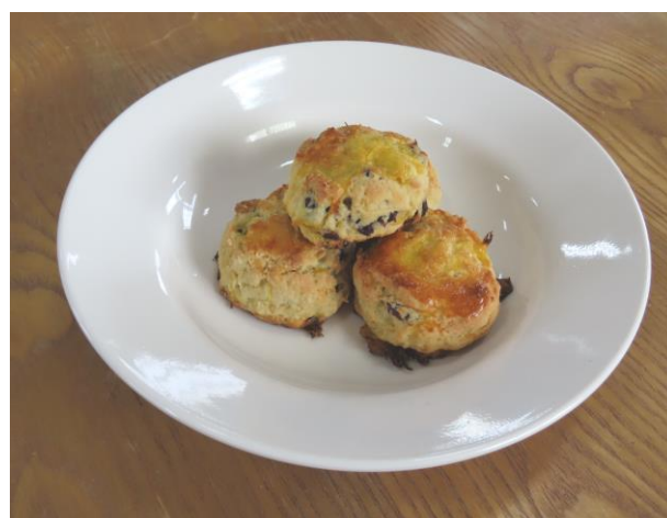
▲香澄、伯爵乳酪司康成品