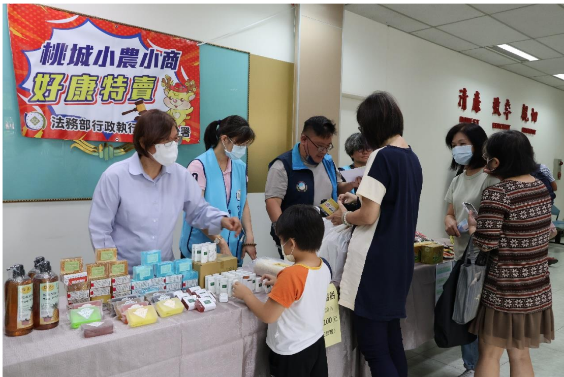
嘉義分署舉辦「桃城小農小商好康特賣」