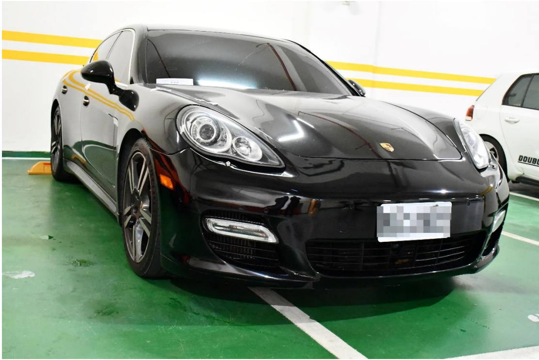
士林分署拍賣黑色保時捷 PANAMERA TURBO 房車