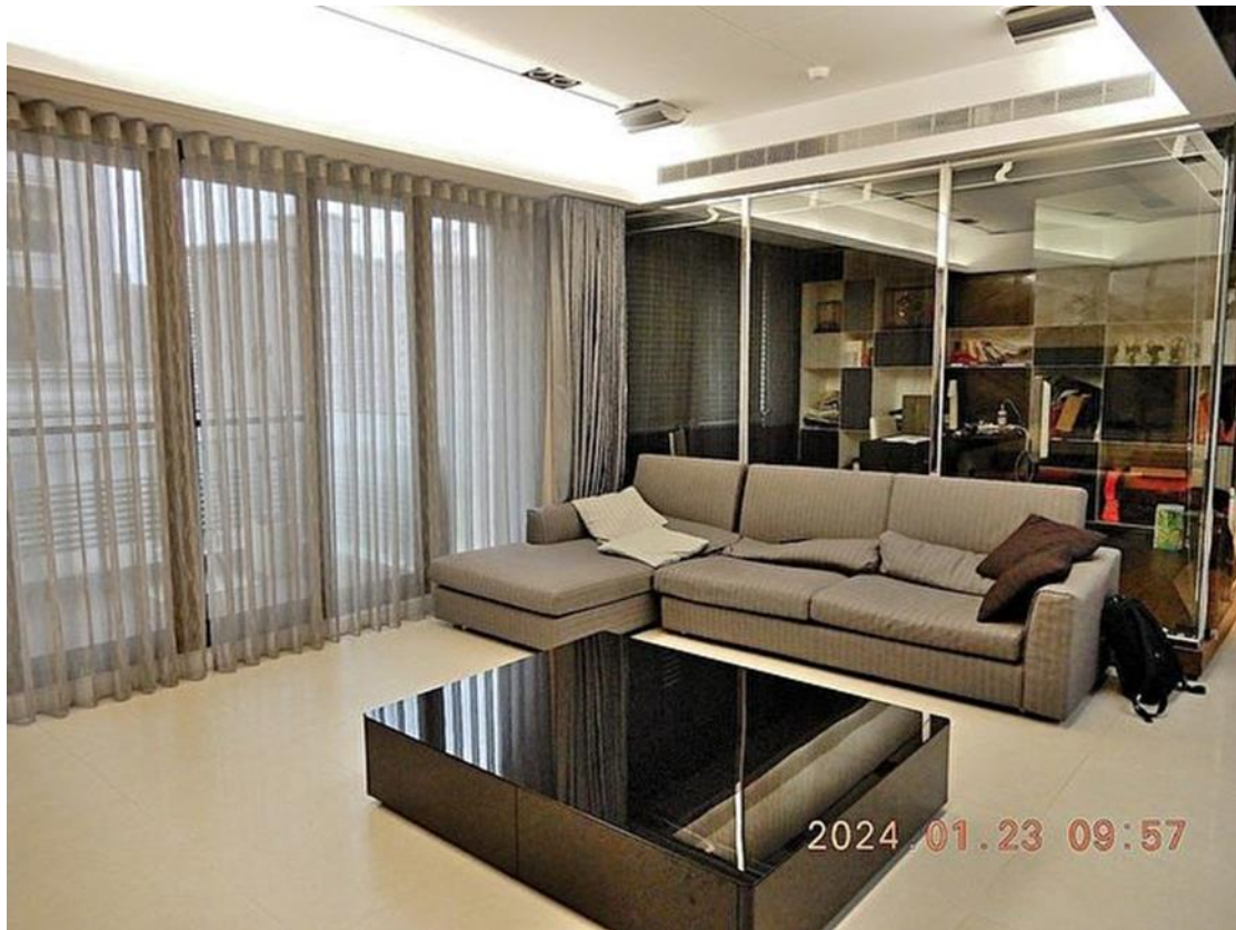
臺北分署拍賣陳姓擔保人大直豪宅