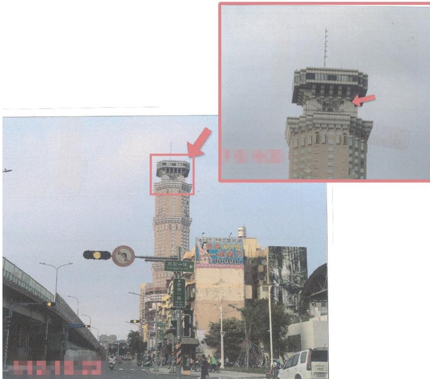
高雄分署拍定高雄市三民區49樓超高樓層商辦