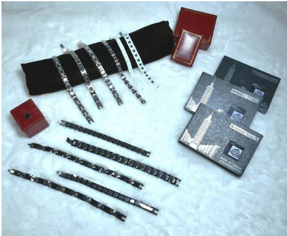
臺北分署拍賣鍺手鏈等好物