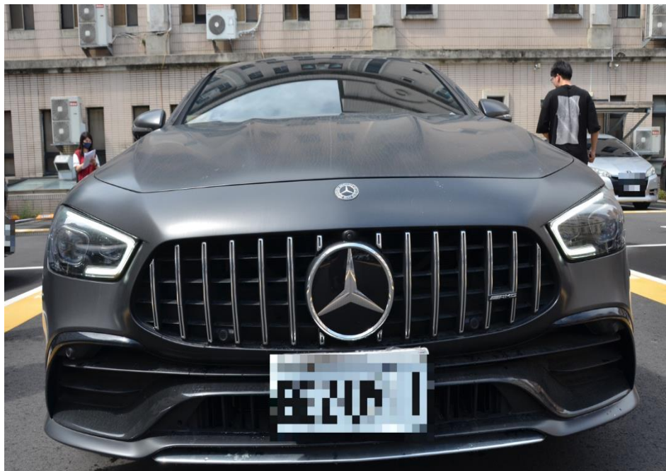
臺中分署受臺中地檢署囑託高價拍定賓士 AMG GT53