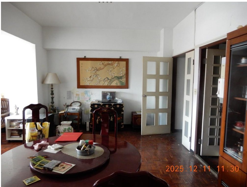
臺北分署拍賣義務人名下位於臺北市大安區龍泉段之土地及新生南路三段之建物，以 3,701 萬元拍定。