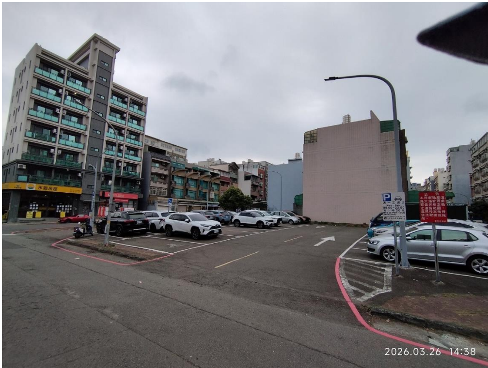
新竹分署拍賣蘇姓滯欠大戶名下之新竹市金山段 723、724 地號土地，以 1 億 3,764 萬元拍定