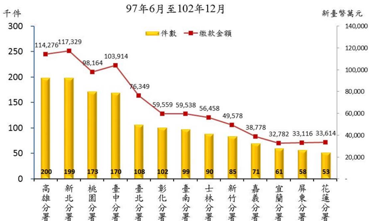
圖 3 行政執行案件多元繳款情形—機關別

五、依執行機關別觀察，97年6月至102年12月行政執行多元繳款件數，以高雄分署20萬件最高，其次是新北分署19萬9千件，桃園分署17萬3千件。同期間多元繳款徵起金額，以新北分署11億7,329萬元最多，其次為高雄分署11億4,276萬元，臺中分署10億3,914萬元。(詳圖3)